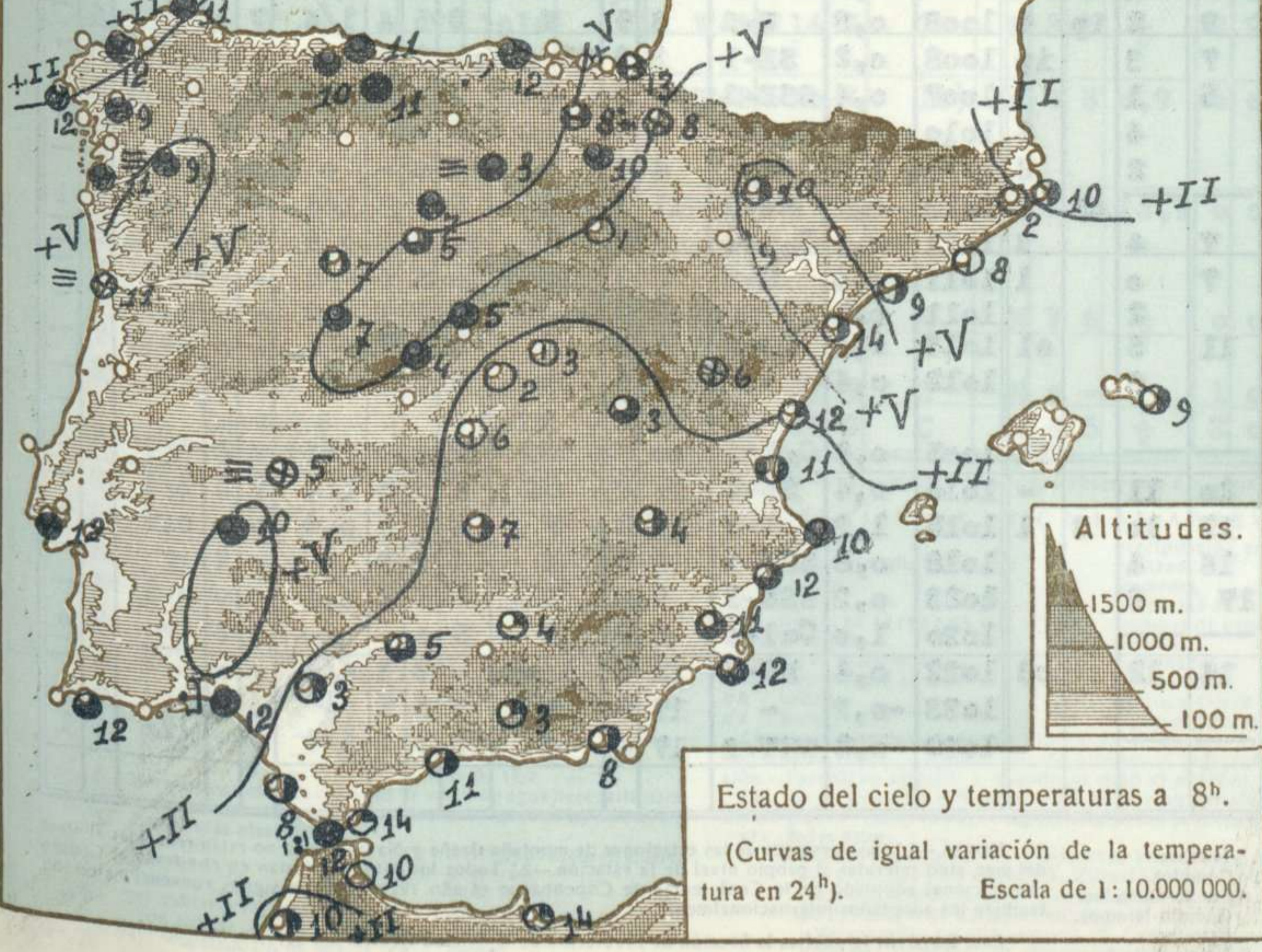
Estado del cielo y temperaturas a 8 h . (Curvas de igual variación de la temperatura en 24 h ). Escala de 1:10.000.000.