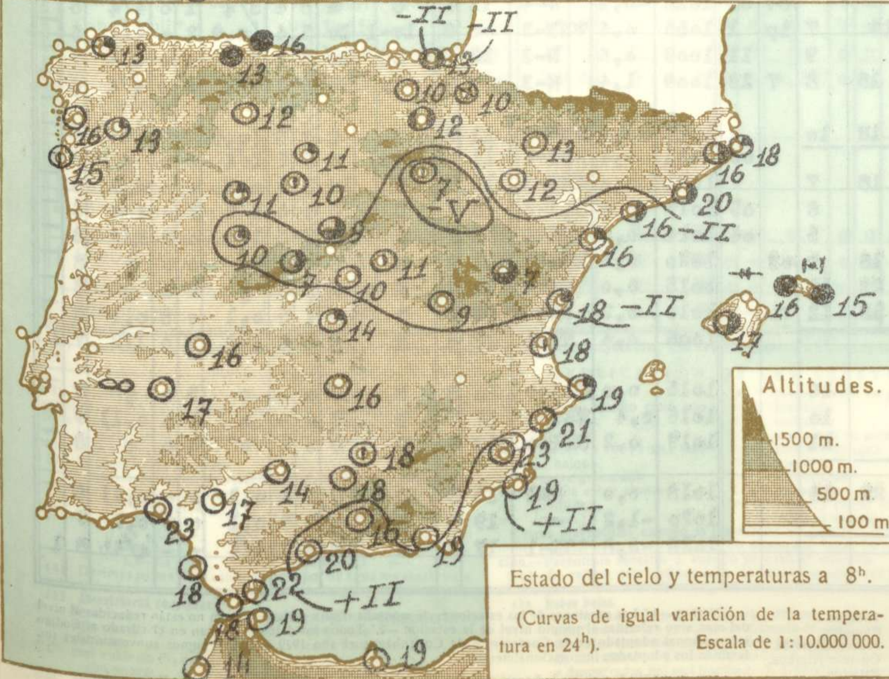
Estado del cielo y temperaturas a 8 h . (Curvas de igual variación de la temperatura en 24 h ). Escala de 1:10.000.000.