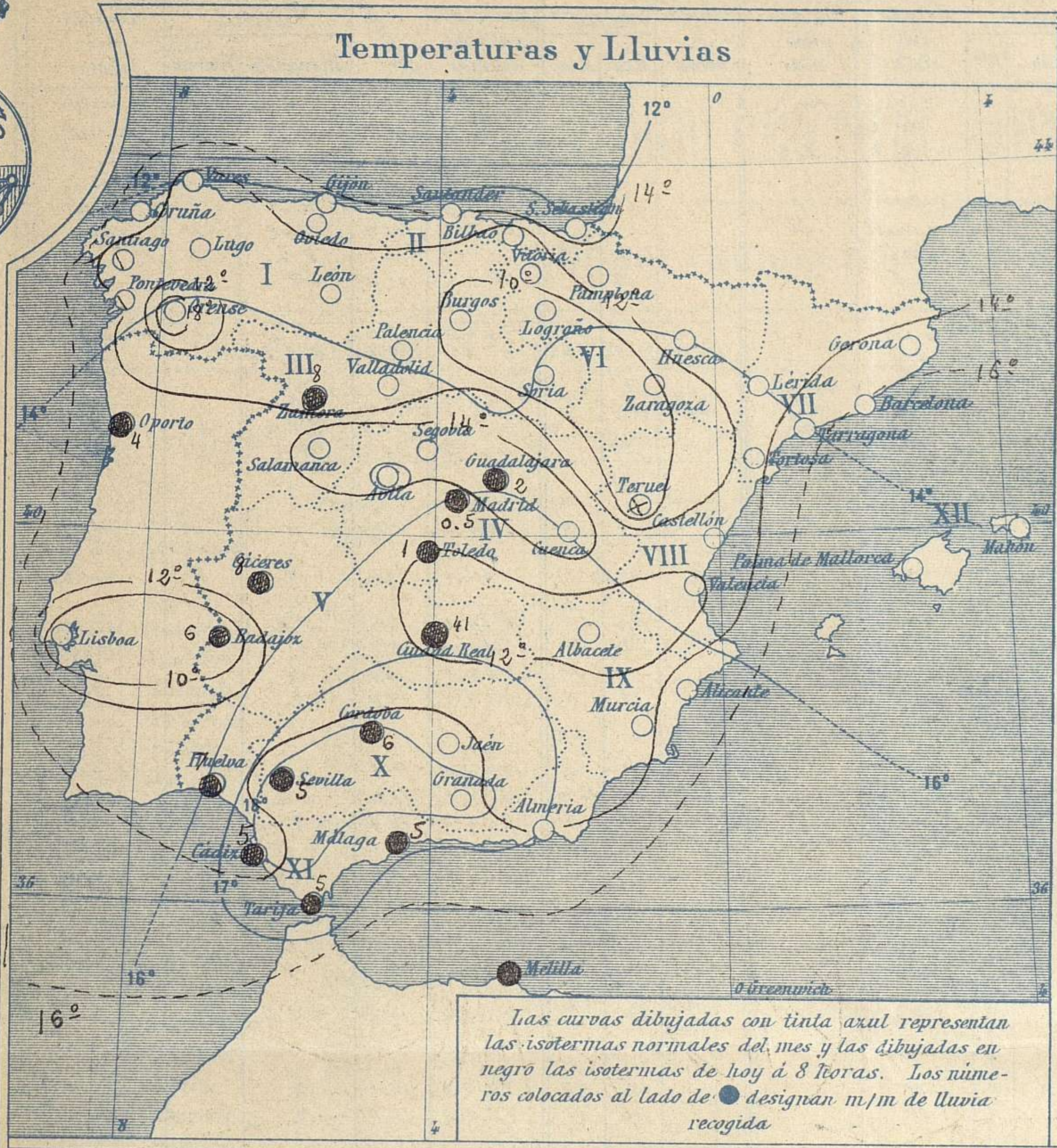
Las curvas dibujadas con tinta azul representan las isotermias normales del mes y las dibujadas en negro las isotermias de hoy á 8 horas. Los números colocados al lado de ● designan m/m de lluvia recogida

Tiempo probable EN LAS REGIONES I } Vientos bonancibles y frescos de dirección variable y tiempo incierto. II } III } IV } Vientos bonancibles del 1º cuadrante y buen tiempo. V } VI } VII } VIII } Vientos bonancibles de la región del Norte y buen tiempo. IX } X } Vientos bonancibles á frescos de la región del E y tiempo lluvioso. Mar. XI } XII } Vientos bonancibles de la región del W. y buen tiempo. Marejada.