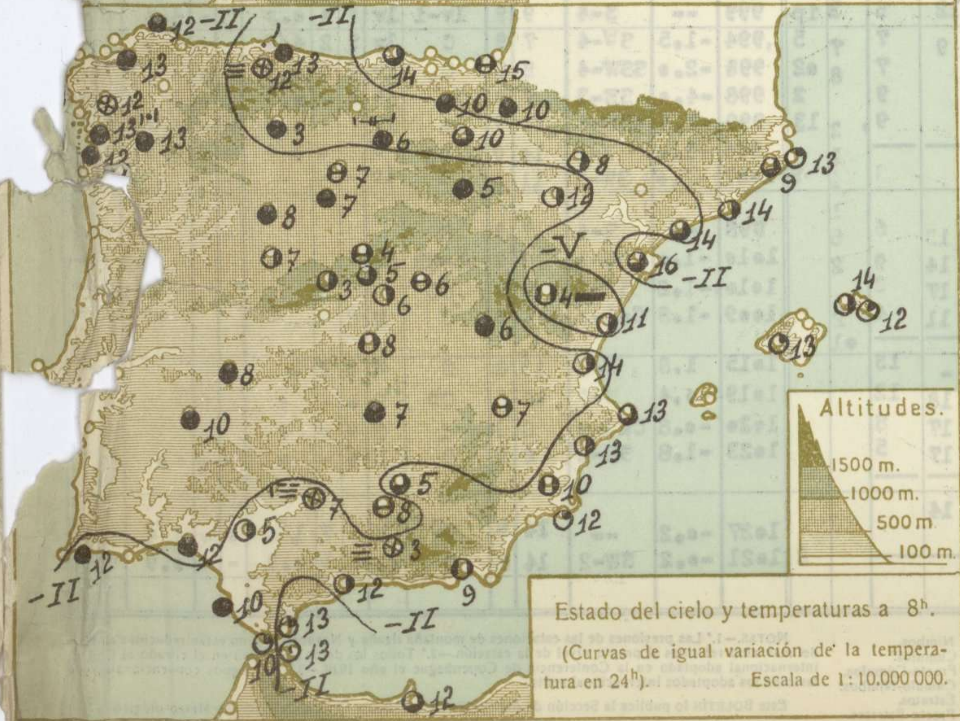
Estado del cielo y temperaturas a 8 h . (Curvas de igual variación de la temperatura en 24 h ). Escala de 1:10.000.000.