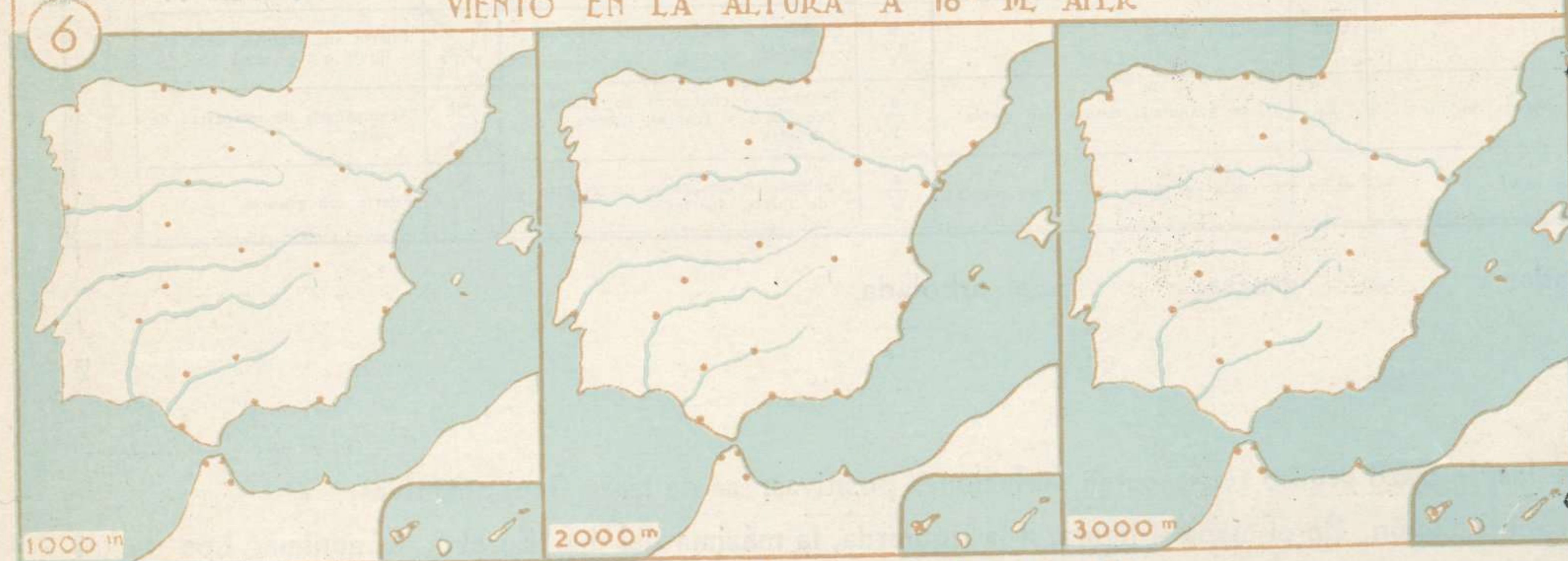
VIENTO EN LA ALTURA A 8 h DE HOY