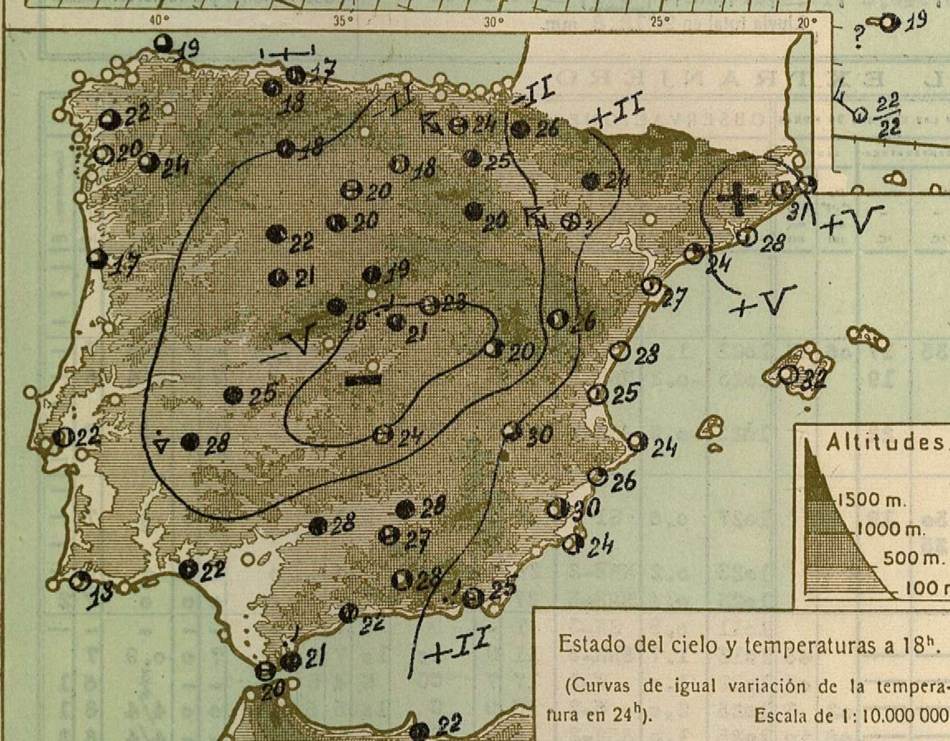
Estado del cielo y temperaturas a 18 h . (Curvas de igual variación de la temperatura en 24 h ). Escala de 1:10.000.000.