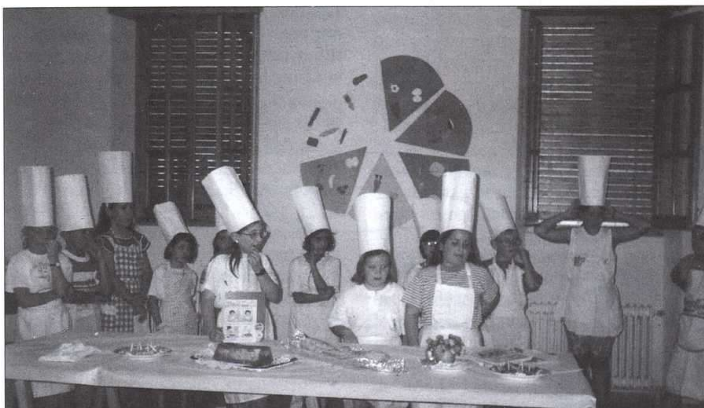
Los niños explican las recetas a las amas de casa.

Los niños y jóvenes de Pétrola (Albacete), los mejores usuarios de la biblioteca del pueblo, organizaron para la Asociación de Amas de Casa de la localidad, una serie de actos tendentes a acercar este servicio a los adultos. La más espectacular de las actividades fue la elaboración, en la propia biblioteca, de algunos platos basados en recetas que los niños encontraron en los libros de cocina de la biblioteca.