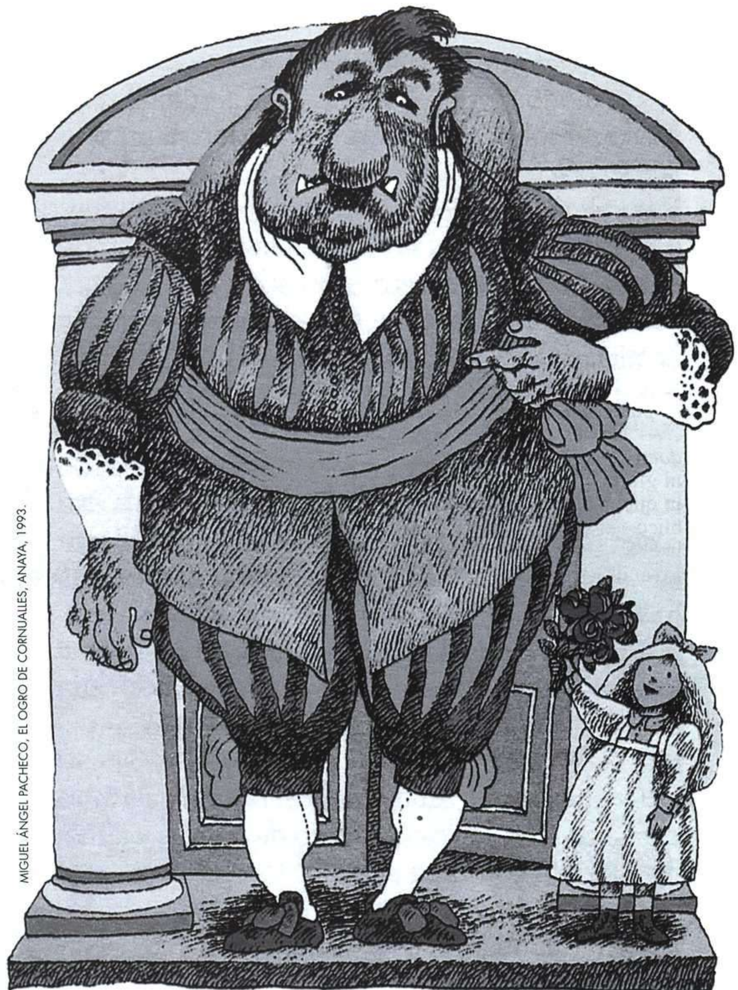
MIGUEL ÁNGEL PACHECO, EL OGRO DE CORNUALLES, ANAYA, 1993.

«La lectura está agonizando. Mi generación, y algunos contaminados posteriores, somos la última generación de lectores. En el futuro, no se va a leer.»