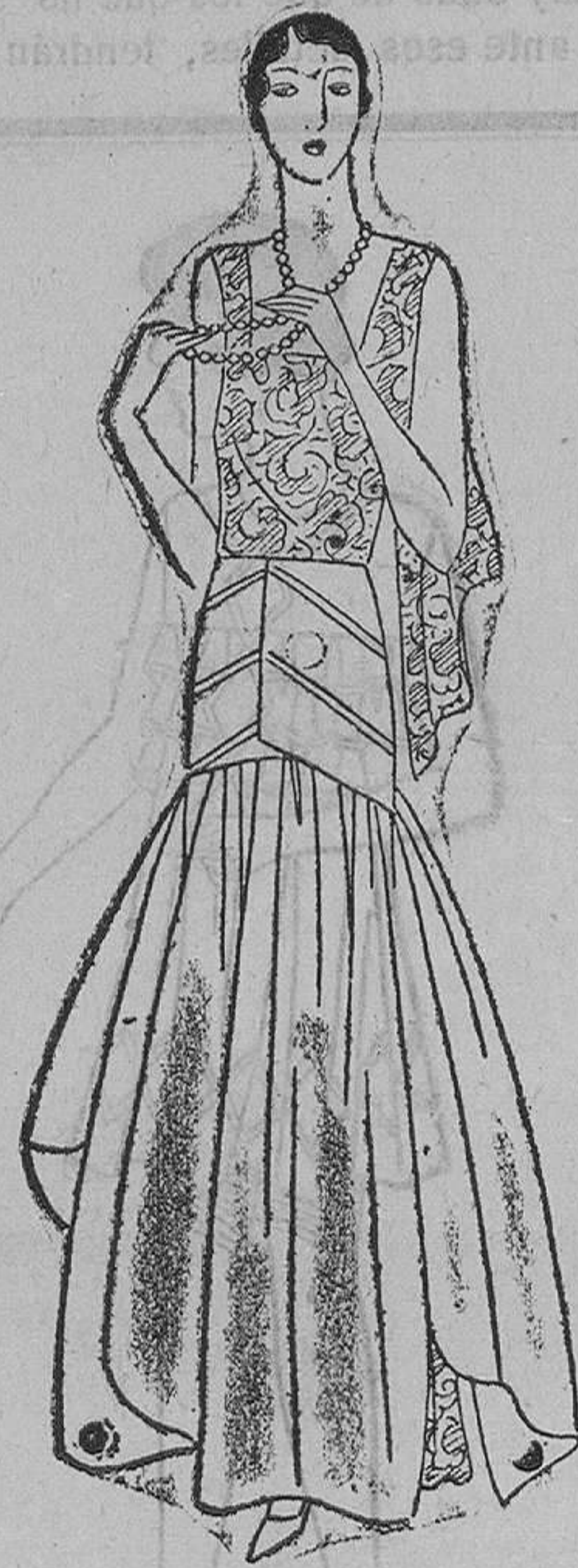
Vestido de taffetas blanco y puntilla blanca

Pero como a la higiene del sueño contribuya poderosamente la higiene de la cuna, de ella y sus detalles nos ocuparemos en el número próximo.