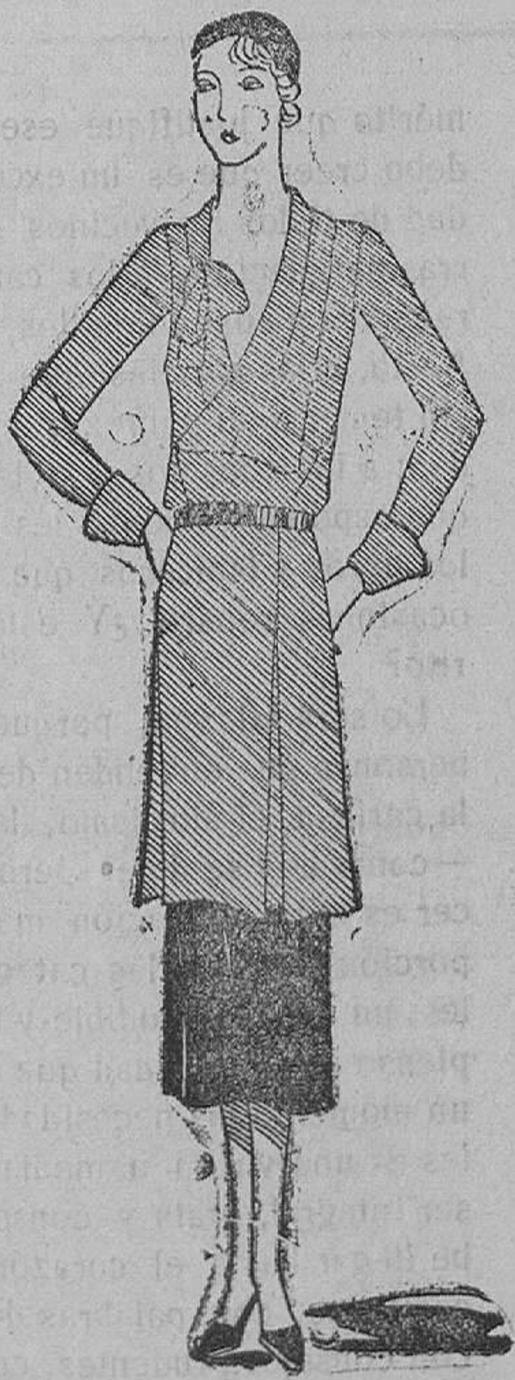
Túnica en crepé de china azul, sobre una falda de pana negra

Más como, al parecer, una gran parte de mujeres (y no todas, porque las hay que han arun-