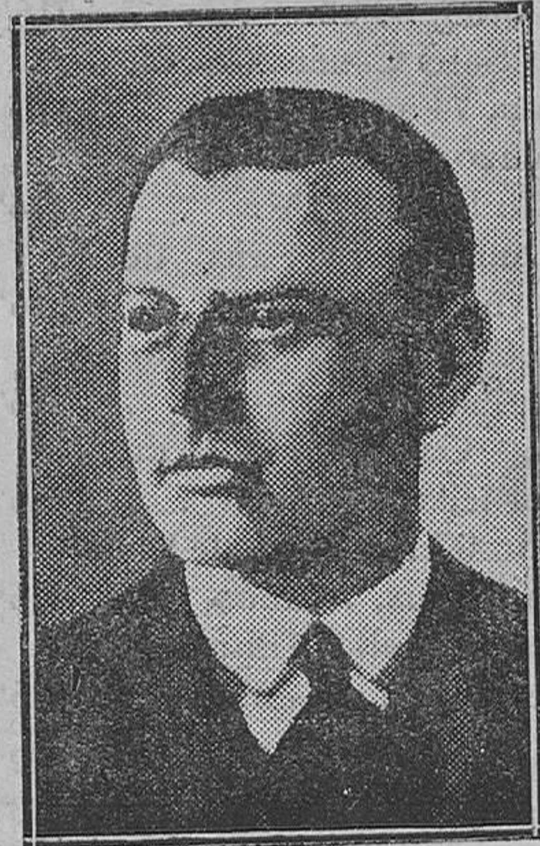
El mayor Fey, jefe de los «Heimwehr» de Viena, que pronunció un discurso en la manifestación nacionalista celebrada en la capital austríaca

Aprobar el presupuesto ordinario y Ordenanzas de exacciones municipales para el próximo año de 1931.