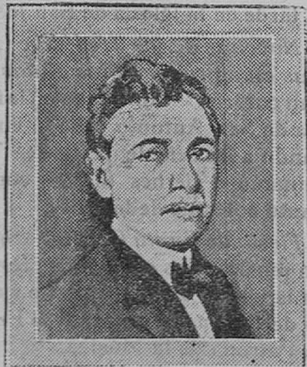
BRASIL.—El señor Mello Franco, que se ha hecho cargo del Ministerio de Negocios Extranjeros en el Gobierno provisional del Brasil