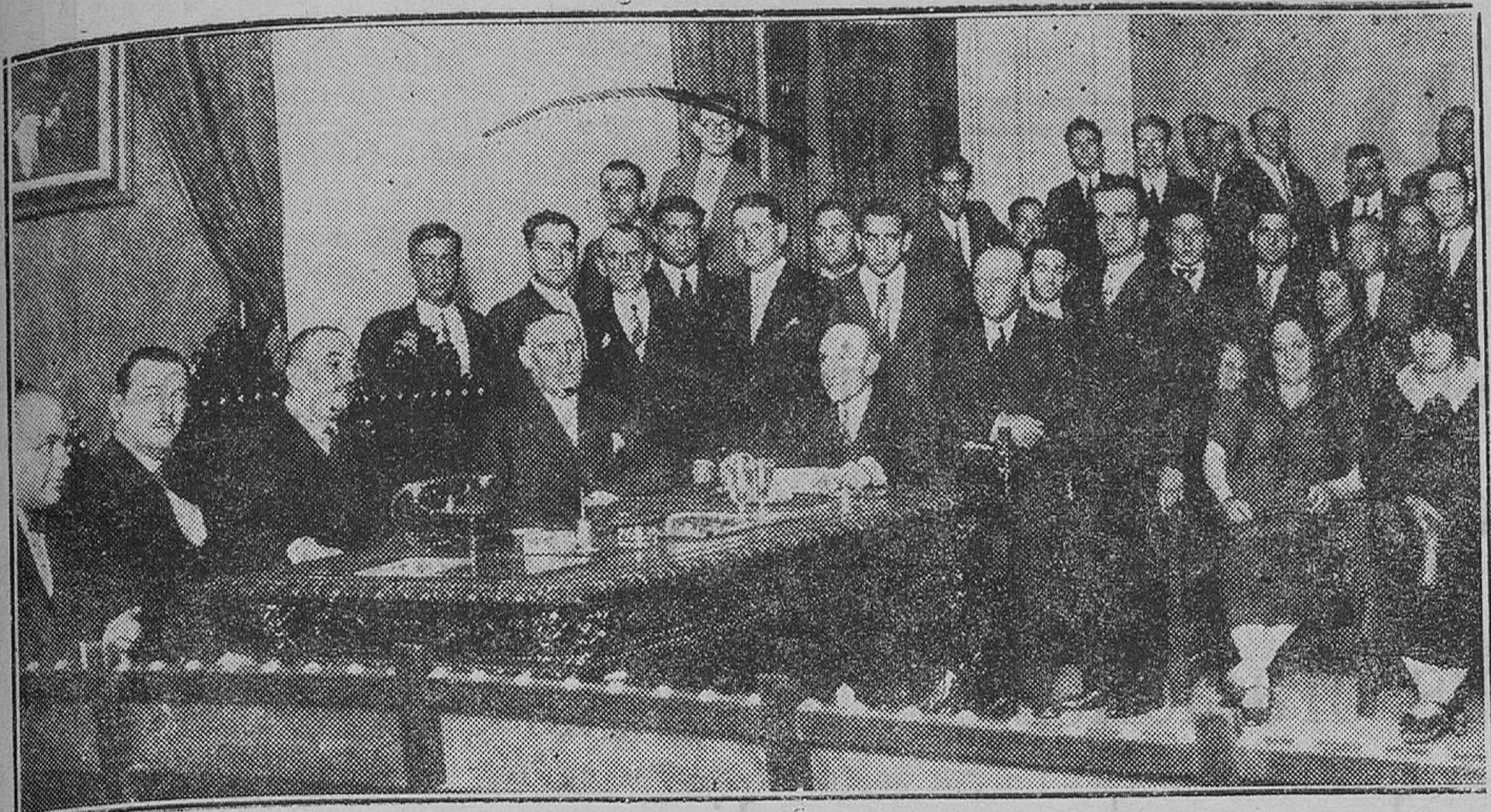
MADRID.—En el Colegio de Médicos.—Constitución del Colegio oficial de Practicantes, con asistencia del Gobernador Civil