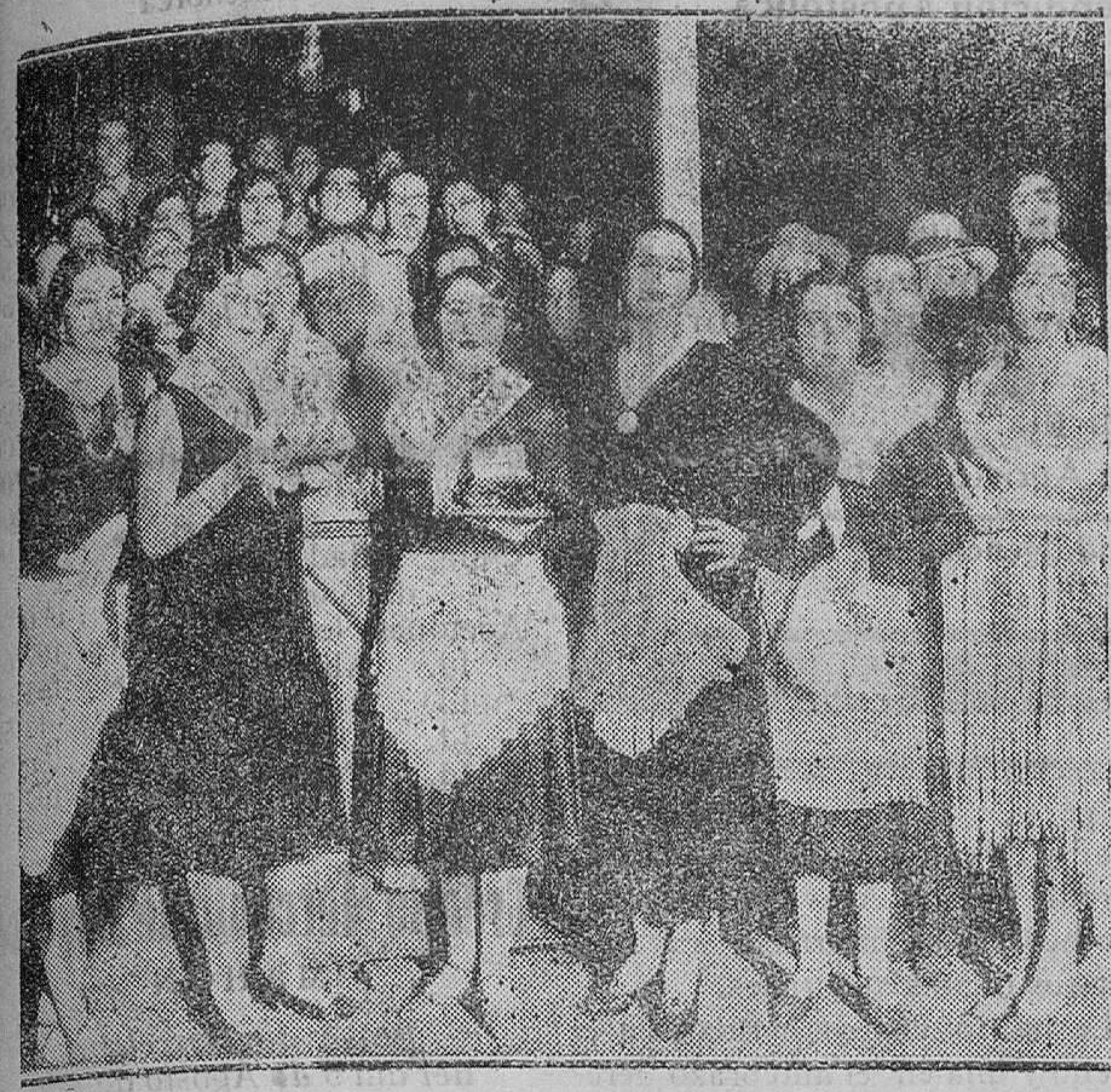
MADRID.—La verbena organizada por el Sindicato de Actores en el Parque de Recreos del Retiro.—En la foto se ven algunas de las artistas que estuvieron en los puestos sirviendo refrescos y vinos