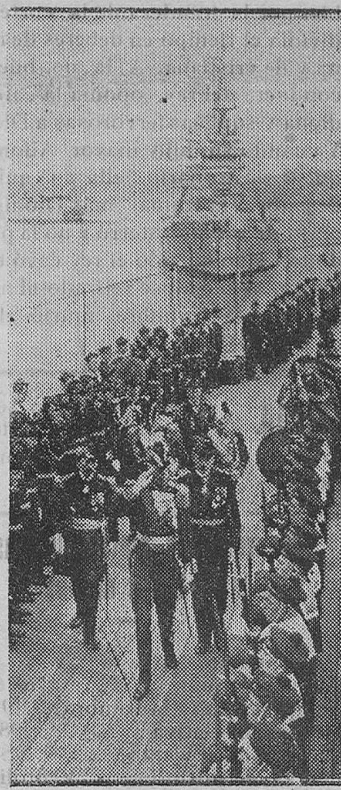
EXTRANJERO.—Llegada a Estocolmo de una Escuadra francesa, entre cuyas unidades figuran el «Duquesa», que es el crucero francés más recientemente construido

y ciudadanas se multipliquen con el esfuerzo de sus hijos que hoy en las industrias de la paz tan alto han sabido poner el nombre de Ciudadela dentro y fuera de las patrias fronteras.