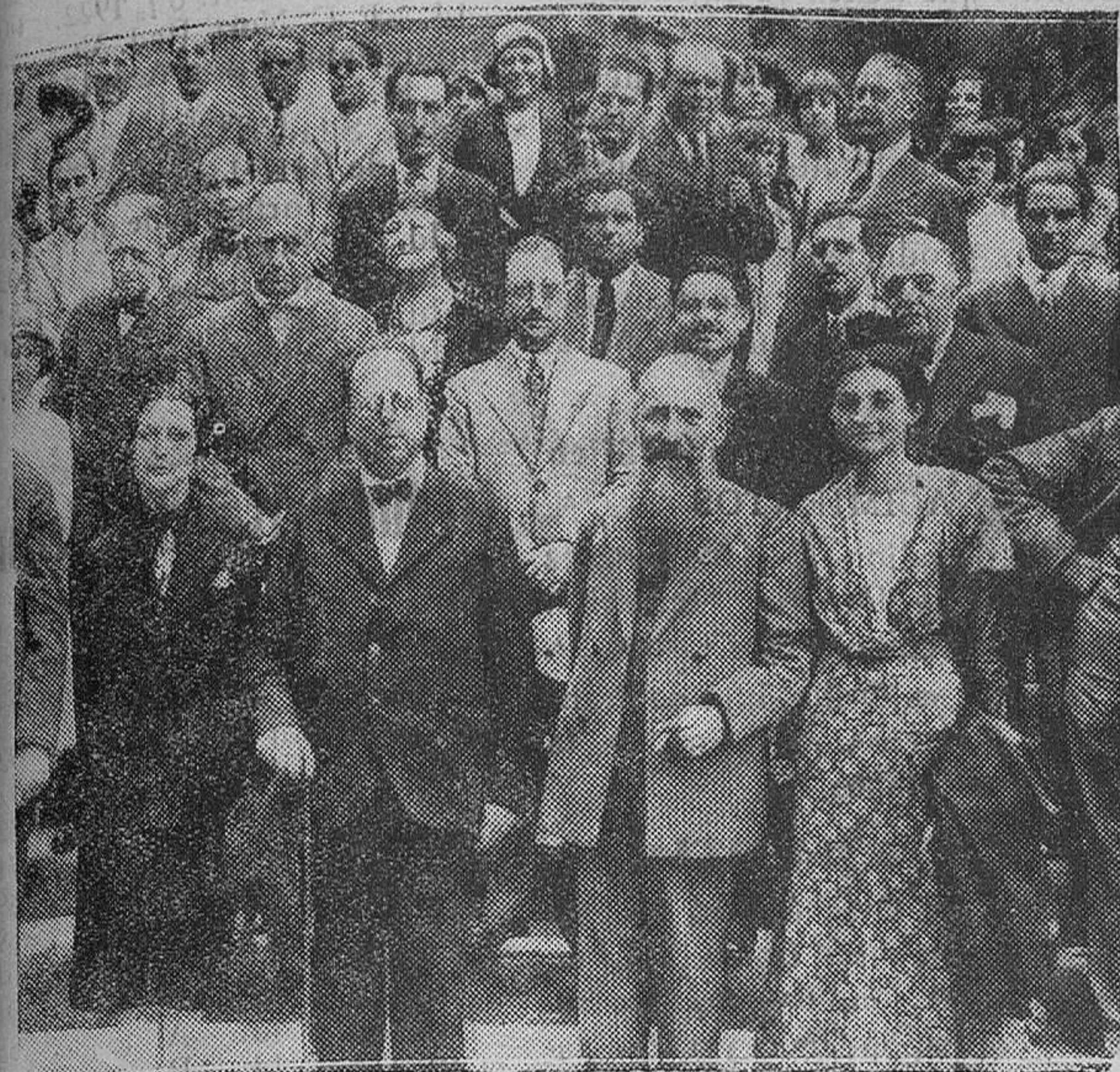
BARCELONA.—El Centenario de Mistral.—La Diputación obsequia con una excursión a Montserrat al sobrino de Mistral y demás poetas llegados a la Ciudad Condal