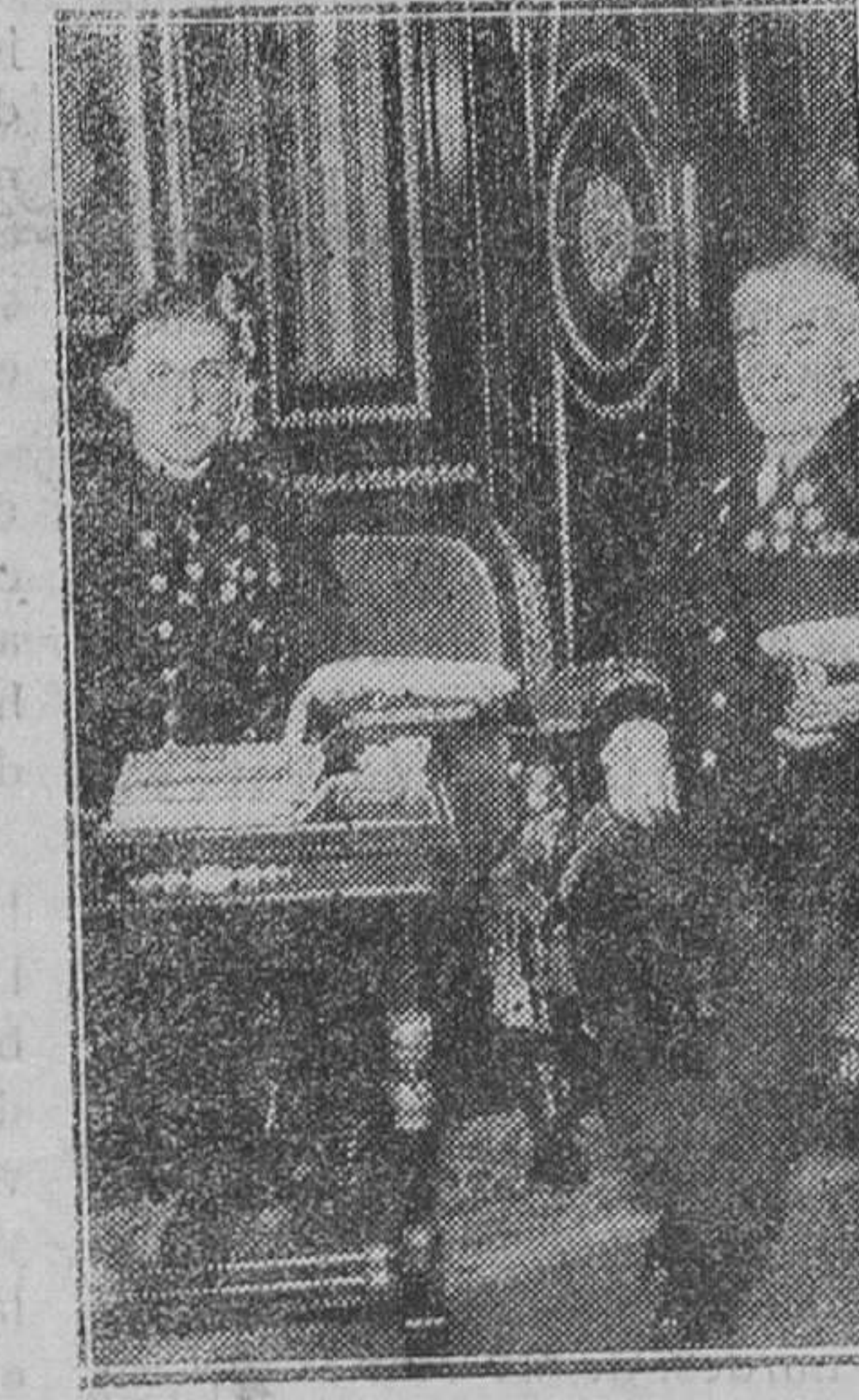
MADRID.—La primera visita oficial de Infante Don Juan con uniforme de la Armada, al ministro de Marina