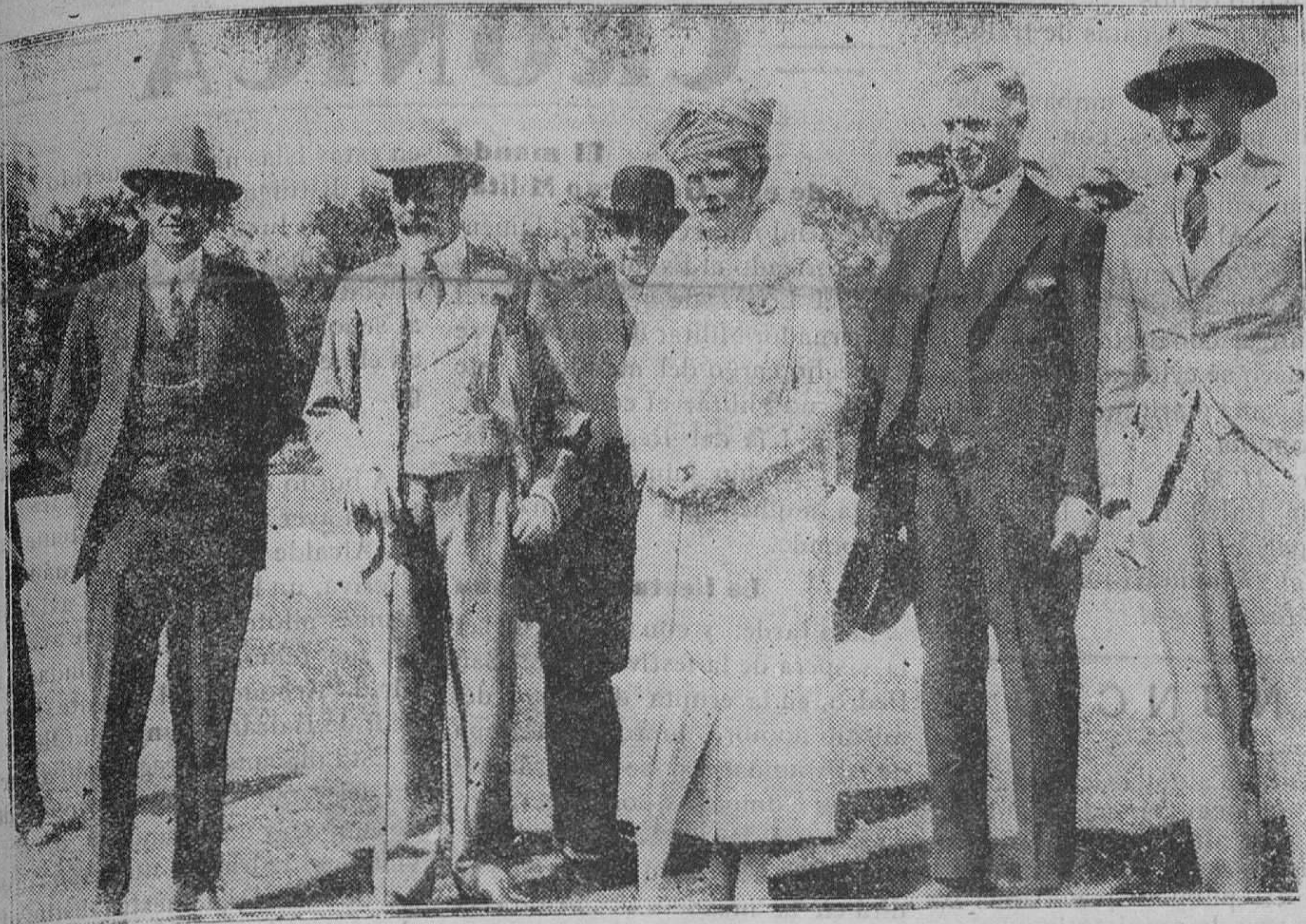
EXTRANJERO.—La Reina María de Inglaterra y el Rey Jorge, acompañado por los jugadores australianos de cricket Alfield, Woodfull, Haver, Kelly y Richardson, durante la visita que hicieron a la residencia real de San Dringham