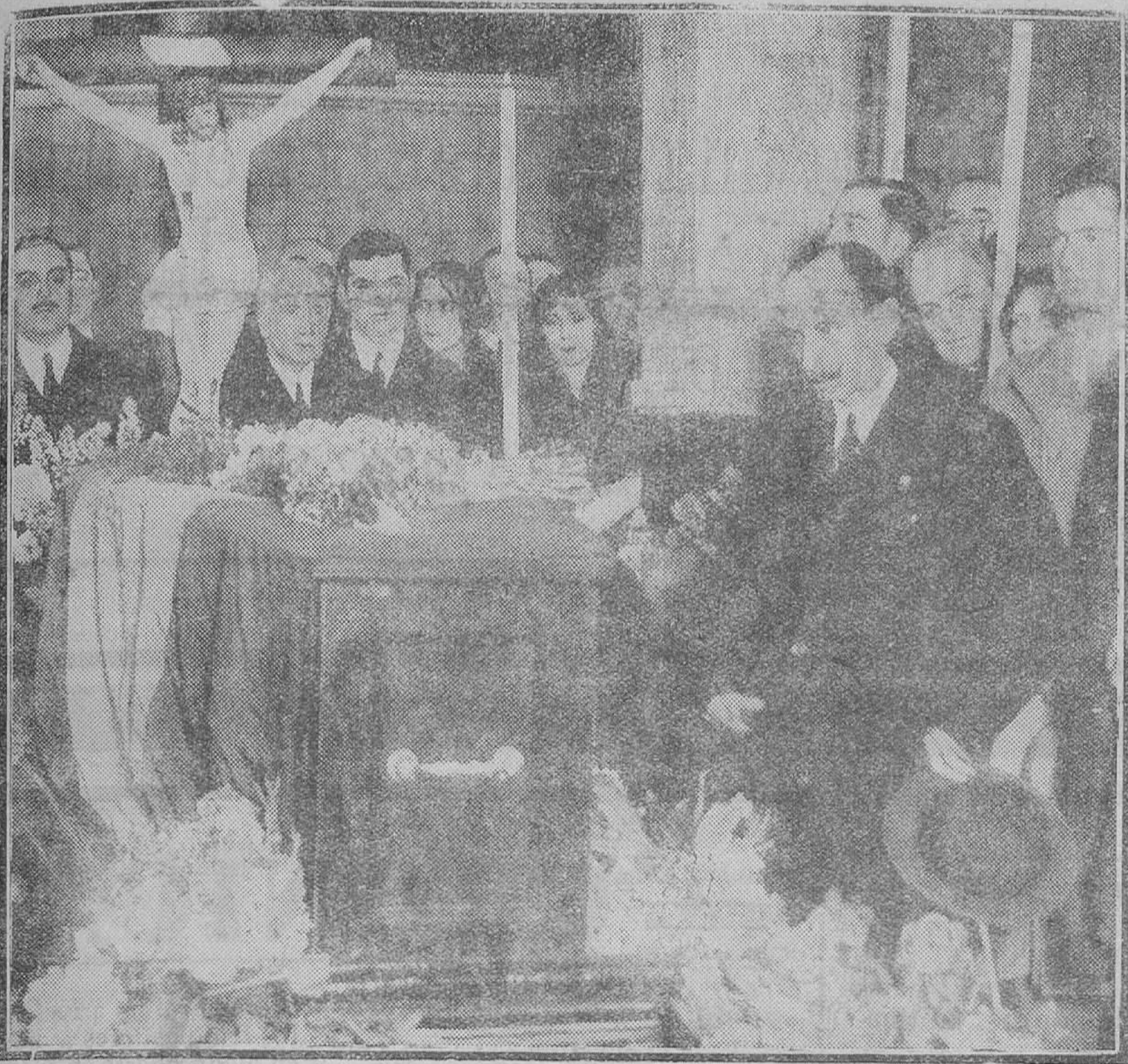
MADRID.—Momento de ser depositado en la capilla ardiente de la estación del Norte el féretro con el cadáver del marqués de Estella