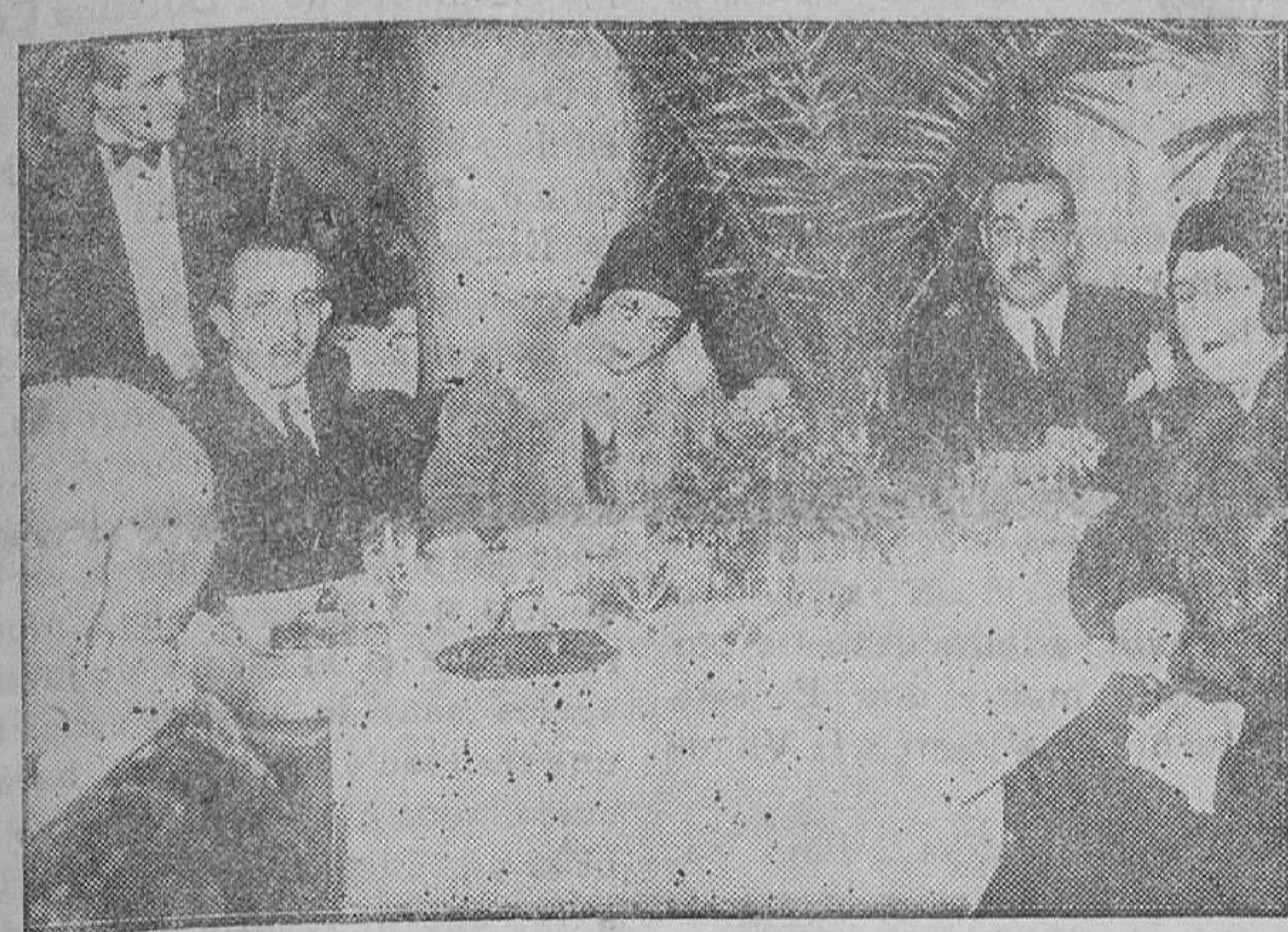
MADRID.—Fiesta aristocrática.—Su Alteza Real el Infante Don Jaime en el festivo celebrado a beneficio del Ropero para niños pobres