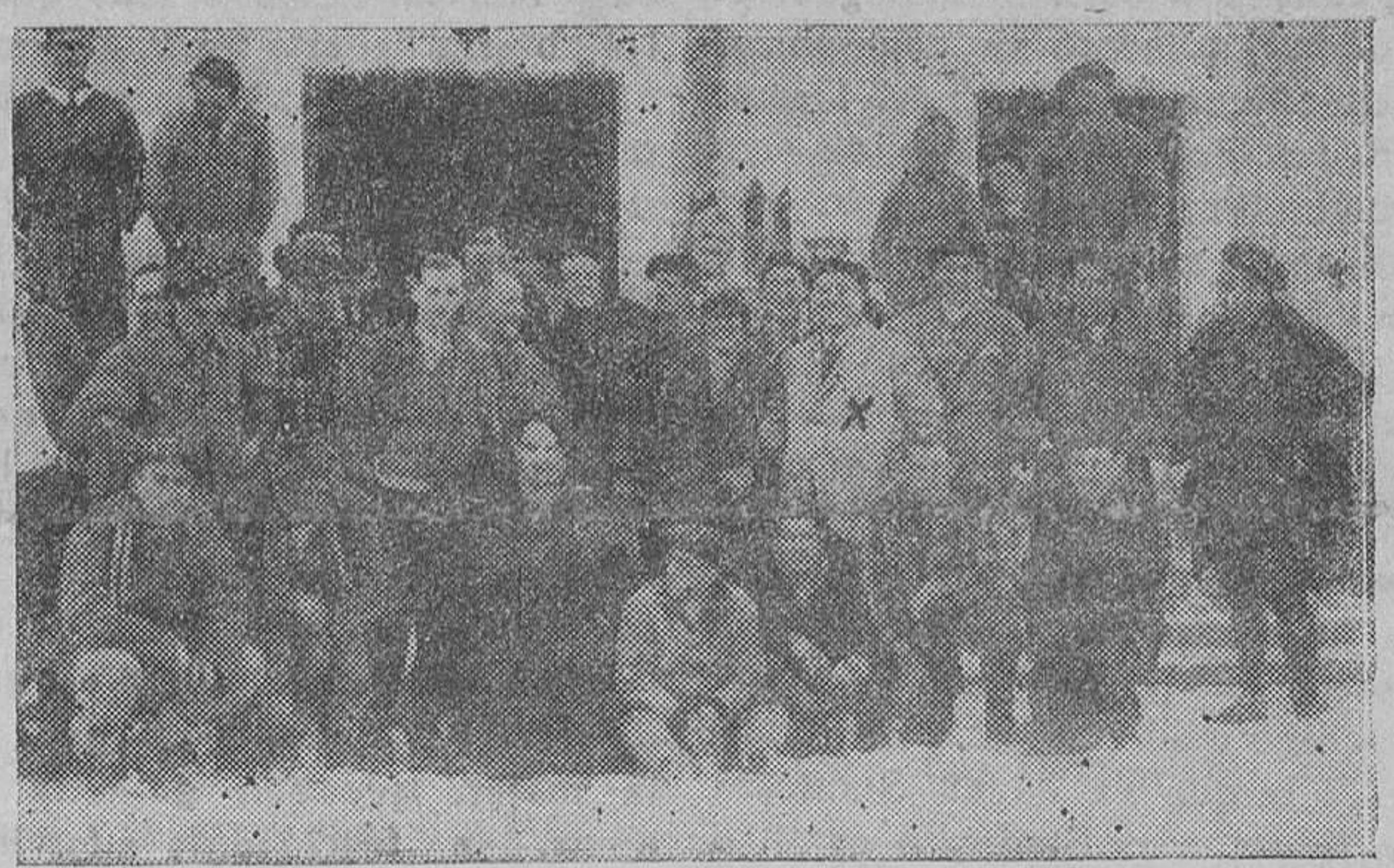
Los deportistas vascos tuvieron que suspender su campeonato de fondo en esquís por exceso de nieve

Vivamos prevenidos, agrupados en un solo bloque, donde se emboten las armas de los contrarios, con el pensamiento en alto, dispuestos a servir al bien público en la medida de nuestras fuerzas, ideal de justicia, libertad y orden que está en nuestro credo y deber, que conocemos mejor que quienes nos combaten. Esto mismo es la hora presente nos ha de llevar a no desertar de nuestro puesto a todos, todos, los que llamados a intervenir en la vida pública les sea ofrecido un cargo, sea el que fuere, que tenemos el ineludible deber de aceptar.