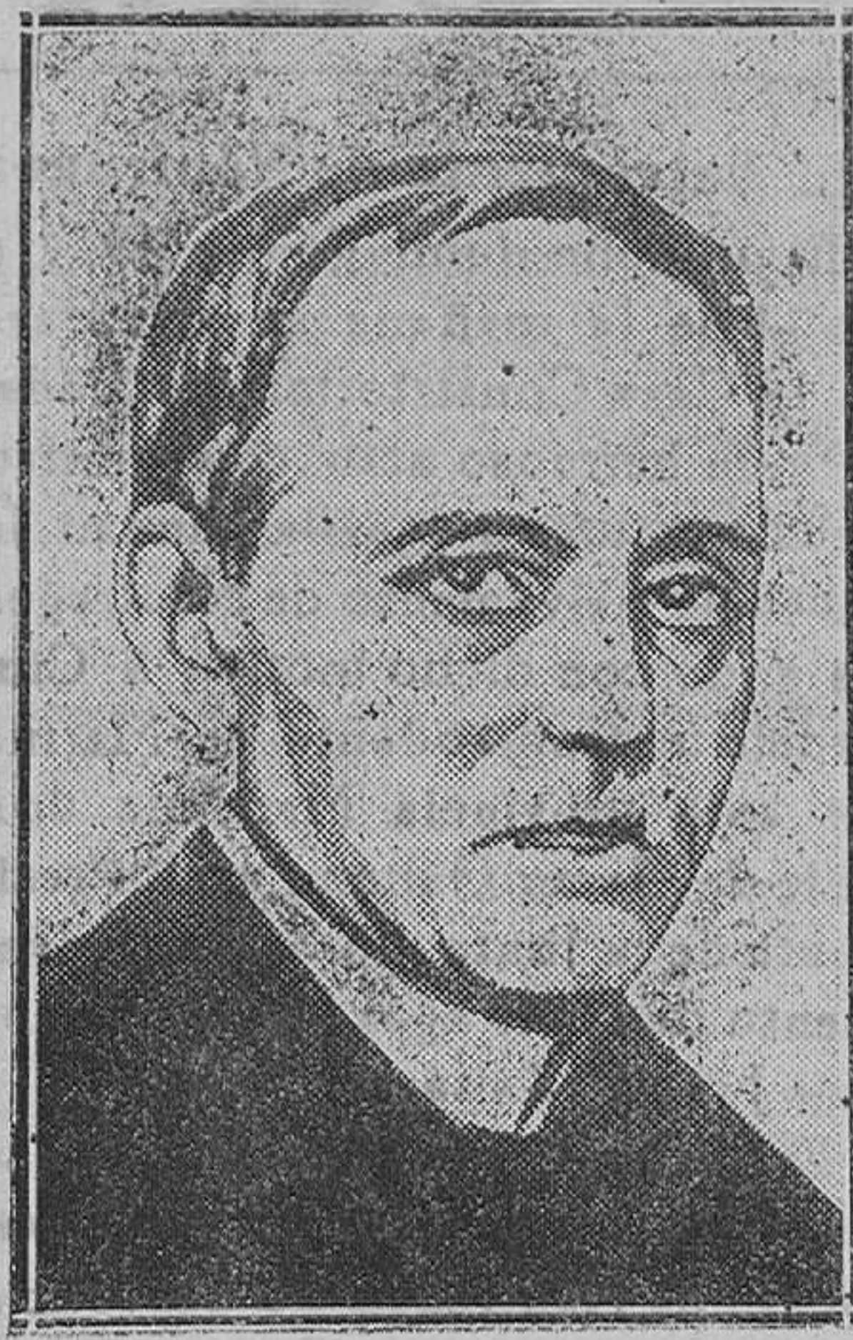
Tardieu, jefe del Gobierno francés, una de las personalidades más destacadas en la Segunda Conferencia de La Haya