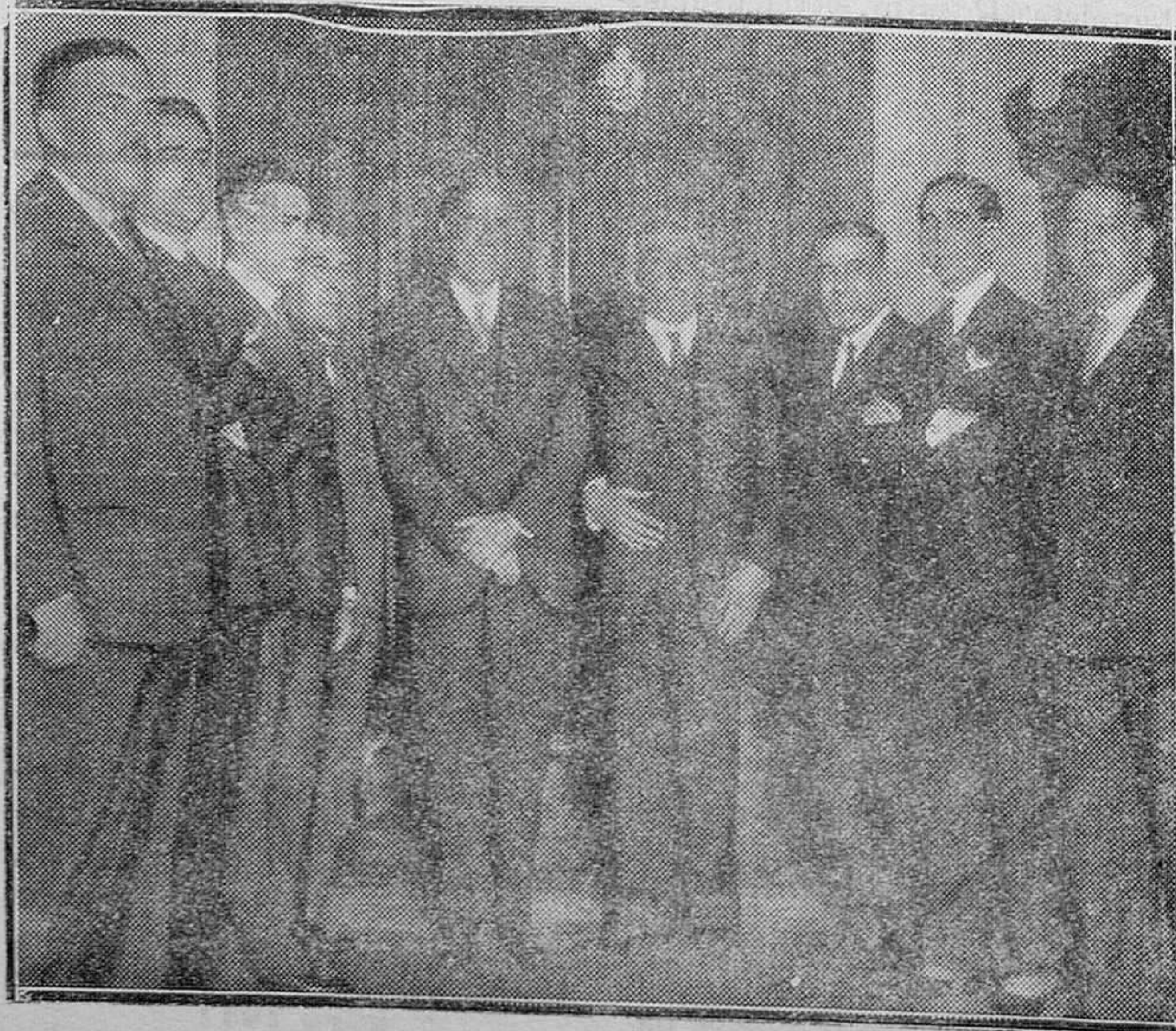
MADRID.—La Mesa del Congreso notificando al señor Alcalá Zamora, en su domicilio particular, que había sido elegido Presidente de la República Española

Santos de hoy: Urbano, V. papa; Timoteo, dc., Nemesio, Darío, Zósimo, Segundo, Ciríaco, Pablito, Anastasio, Mauro, Sindimio, Teas, mártires; Gregorio, ob., Adueto, abad; Fausta, contesor. (Tempo-