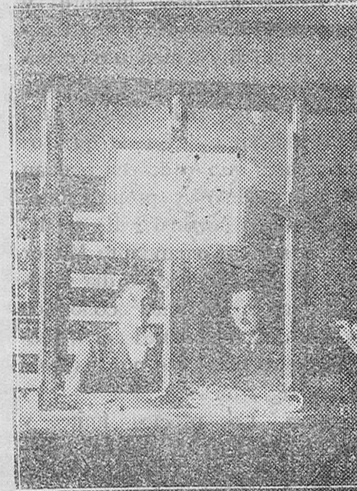
BILBAO.—Ventanilla donde se cometió el atraco en la Caja de Ahorros de Las Arenas

Como quiera, nos encontramos en presencia de una nueva legalidad constituida. No importa cómo se constituyera, para acomodar a ella nuestra conducta. Católicos por encima de todo, nos atenemos escrupulosamente—como hemos hecho siempre—a las normas pontificias, tan antiguas como la Iglesia, y que ahora—y sólo ahora—algunos acaban de descubrir Pa-