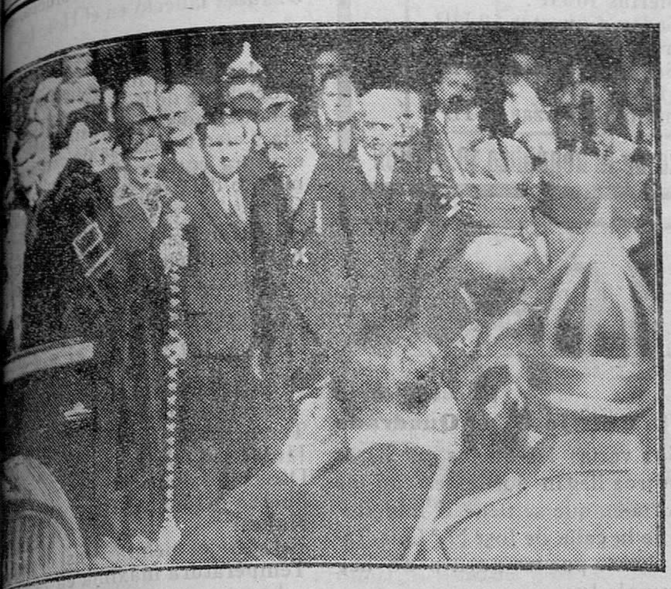
MAHÓN. — En la iglesia de la Coronación tuvieron lugar los funerales de la Archiduquesa Isabel, esposa del Archiduque Federico de Habsburgo, con asistencia de varios miembros de la familia, entre ellos Don Alfonso de Borbón (x)