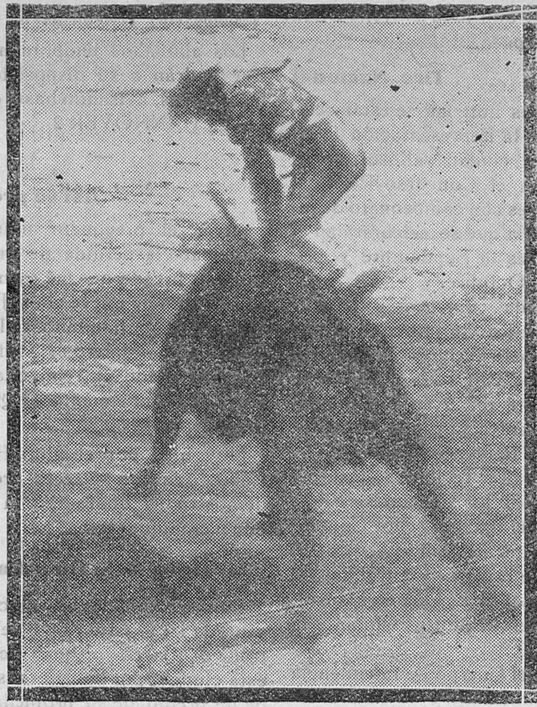
Emocionante momento de la cogida de Alcalaoreño II, a consecuencia de la cual falleció a los cuarenta minutos