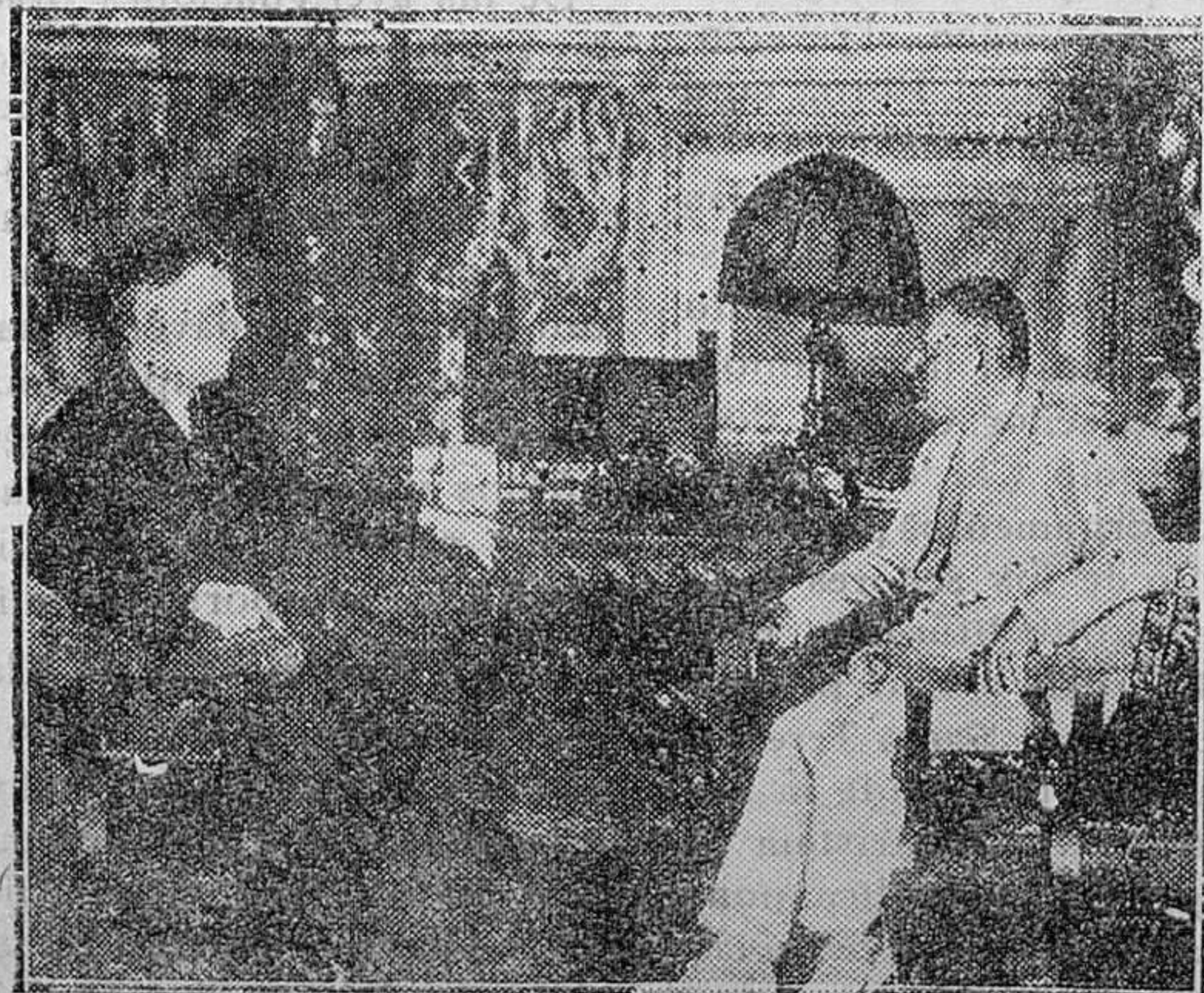
Los señores Mussolini y Stimson, en una de las importantes entrevistas que celebraron en el Palacio de Venecia durante la estancia de este último en Roma

Estamos ya en una circulación fiduciaria de 5.470 millones de pesetas, y como el máximo legal que permite la ley de Ordenación ban-