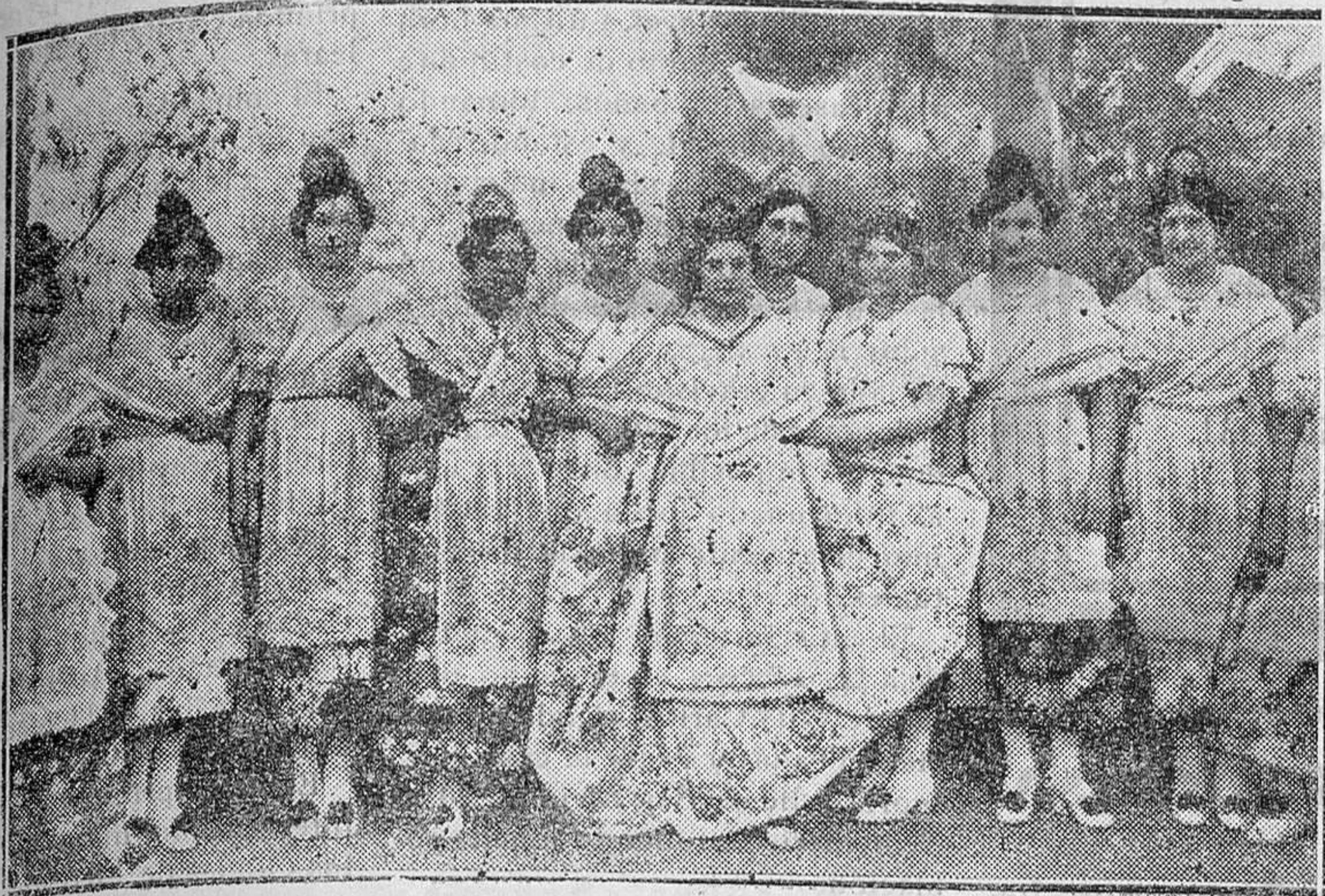
FIESTA DE LA REPÚBLICA.—Grupo formado por levantinas, con los ricos atavíos de Murcia y Valencia, que salieron en la cabalgata