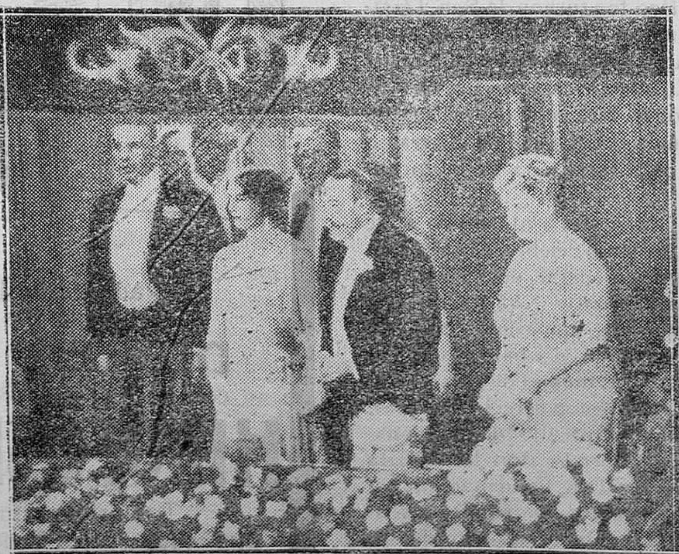
EXTRANJERO.—El Rey y la Reina de Inglaterra con el hermano de la misma y otras personalidades en el palco regio durante una función en Londres, siendo la primera vez que el Rey Jorge se presentaba en público después de su última enfermedad.

Domingo 1.º después de Pascua de Pentecostés 31 de Mayo, Fiesta de la Santísima Trinidad.—Misas rezadas a las seis menos cuarto, siete, ocho y media y doce. A las