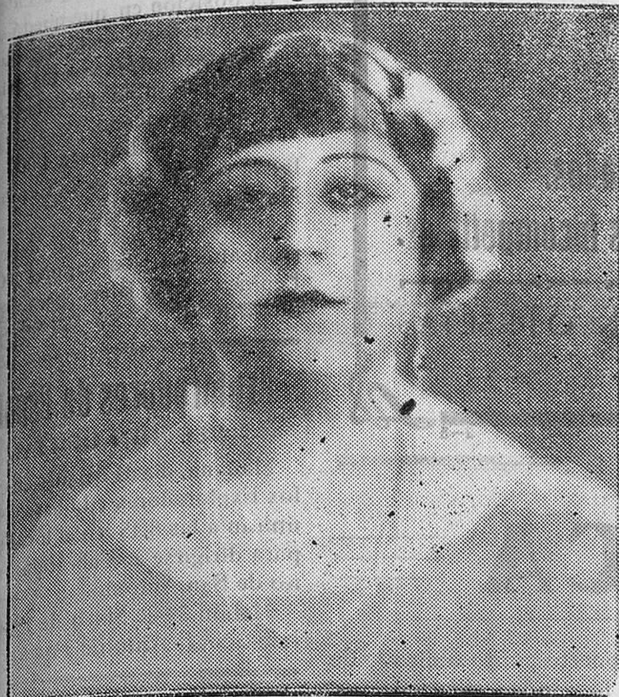
La cantante de ópera Ofelia Nieto, fallecida recientemente en Madrid