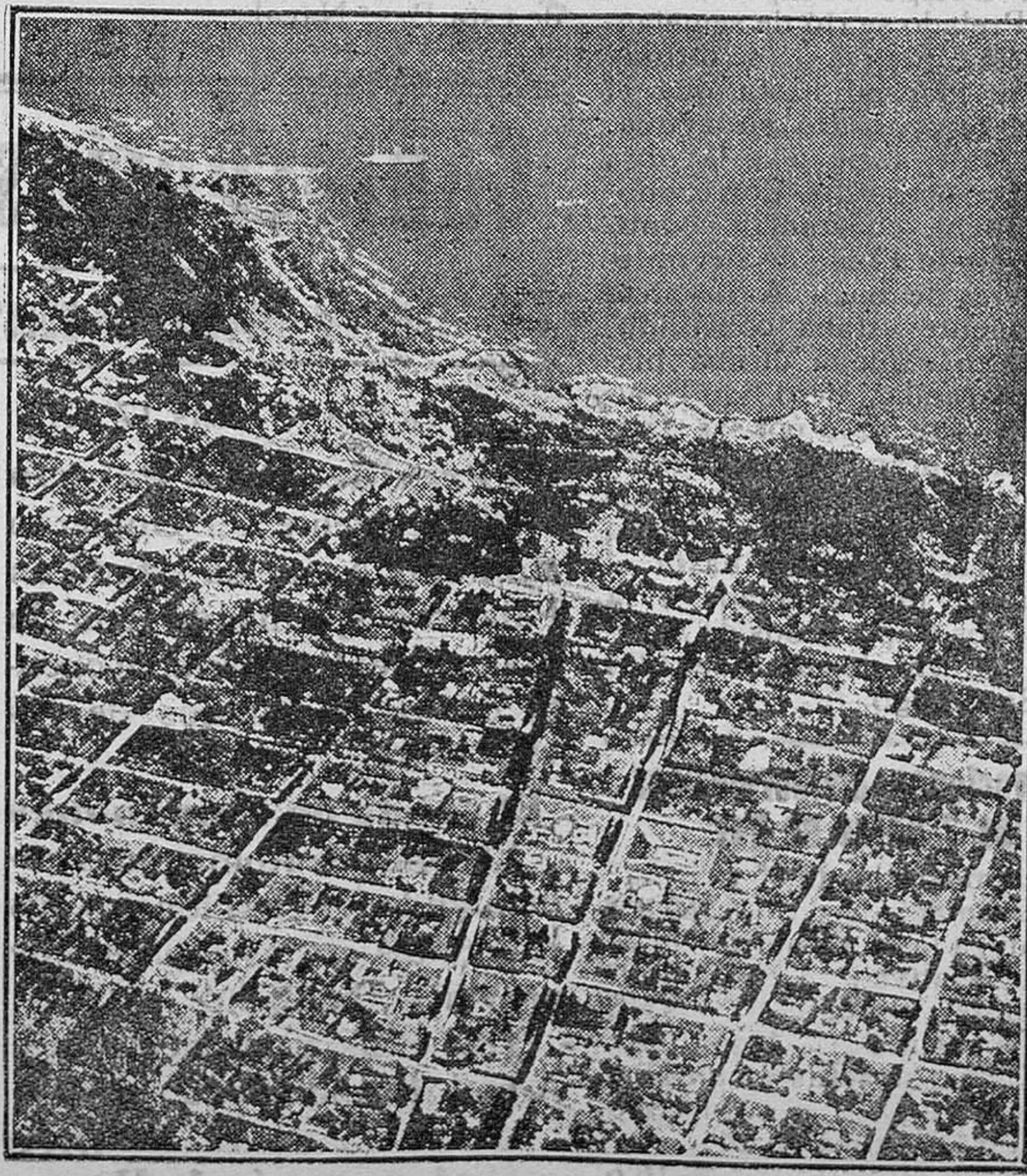
Managua, capital de Nicaragua, que ha sido destruída como se sabe por un espantoso terremoto estos días

Véndense en la Librería de Ma- nuel Sintet Rotger, Plaza del Prín- cipe 17, Mahón.