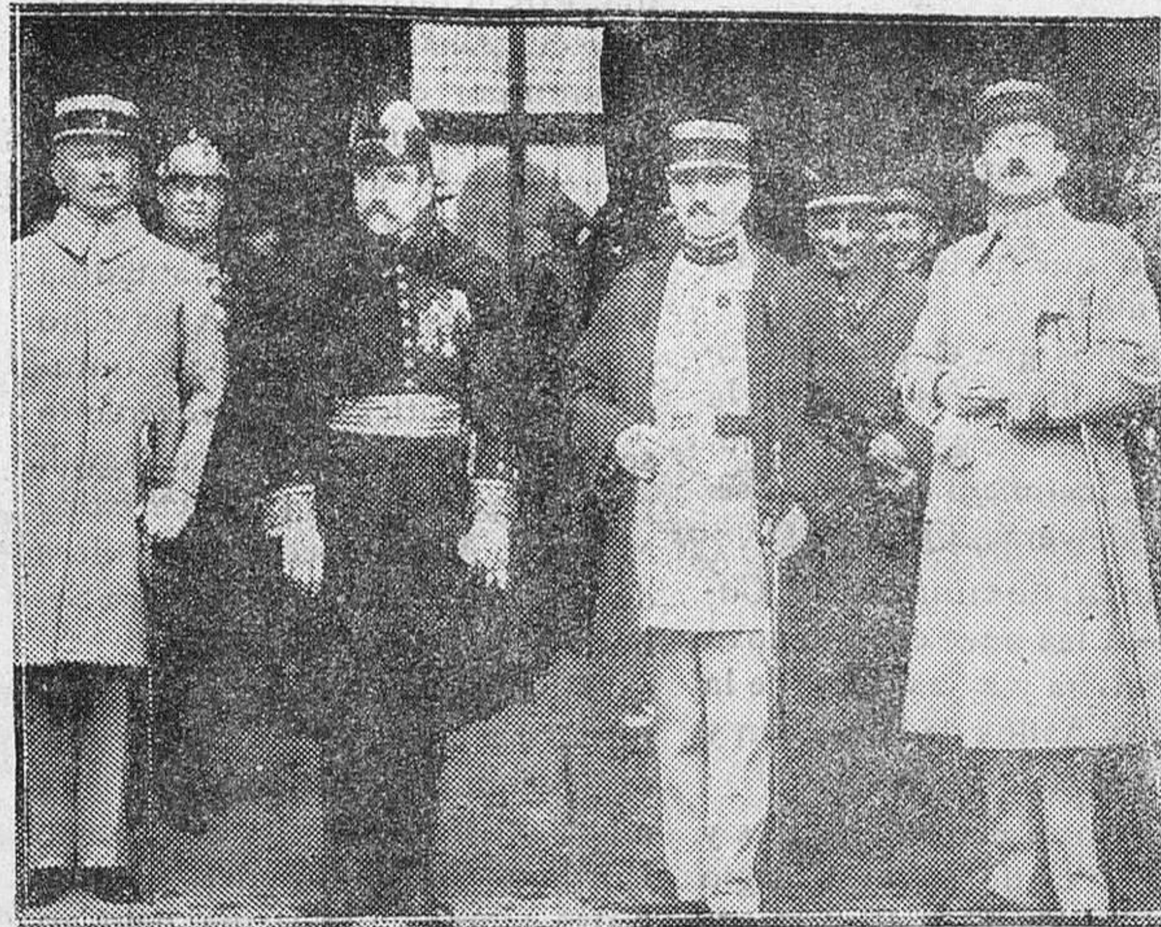
MADRID.—La comisión militar francesa que se encuentra en España en viaje de estudios, y que fué recibida en audiencia por Su Majestad el Rey

Por lo amparándose esta Cámara en las antedichas prerrogativas que le concede su Ley básica y en lo dispuesto en el artículo 4.º del pliego de condiciones para la prestación de comunicaciones marítimas rápidas y regulares de Soberanía, contenido en el Real Decreto del Ministerio de Marina de 4 de diciembre último y recogiendo las observaciones y quejas expuestas ante ella por el comercio y la industria de esta isla, acude en súplica a V. E. que tan dignamente regenta ese Ministerio, para que se digna una vez