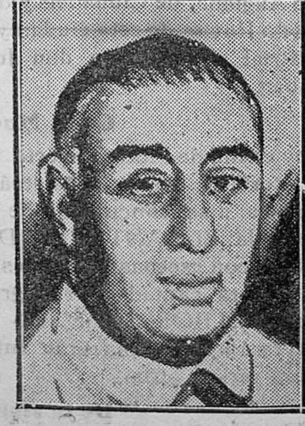
«Big». Bill Thompson, que ha sido reelegido Alcalde de Chicago, donde goza de gran popularidad

Y así, sin responsabilidad por parte de las Empresas, dimanente