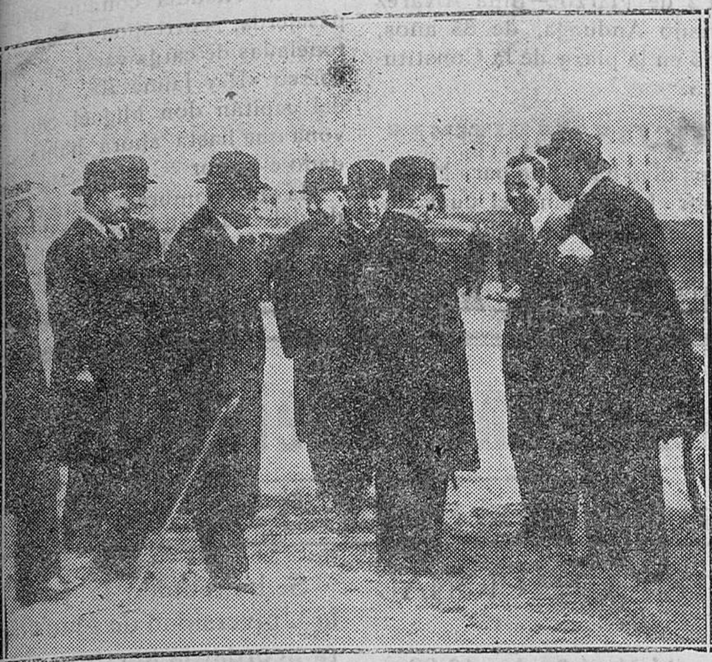
Majestad el Rey con el capitán general Aznar, los ministros conde de Romanones y Marín, el vizconde de Casa Aguilar y otras personalidades, durante su visita a la Ciudad Universitaria