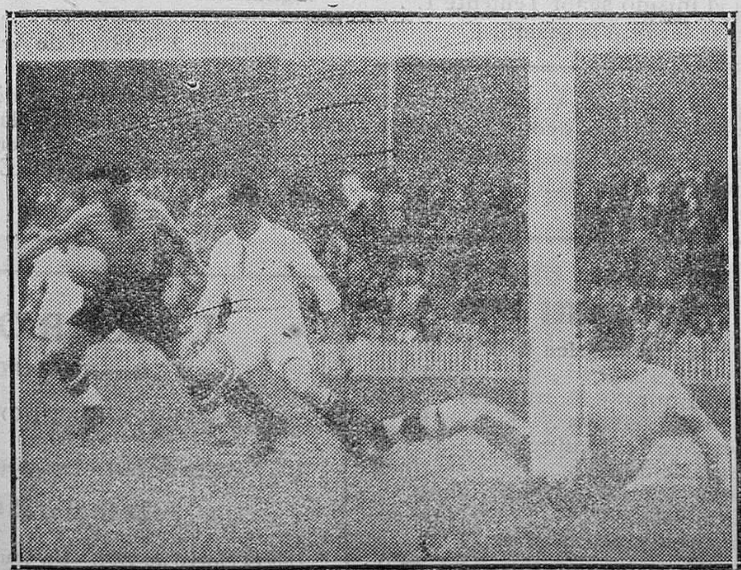
MADRID.—De futbol.—Un momento interesante

De esperar era que así sea. Al abrirse el período electoral se restablecerán las garantías, reintegrándose los derechos ciudadanos y cesando la previa censura de prensa. Libertad de reunión y de expresión de pensamiento: lo que conviene es que se haga buen uso de esos derechos de los que tan celosos debiéramos estar, que el mismo ciudadano debiera ser de ellos guardador para evitar toda conculcación y sofisticación, pues no es justo que la locura o la maldad de unos, los menos por fortuna, sean causa de que se prive al resto de su uso y disfrute.