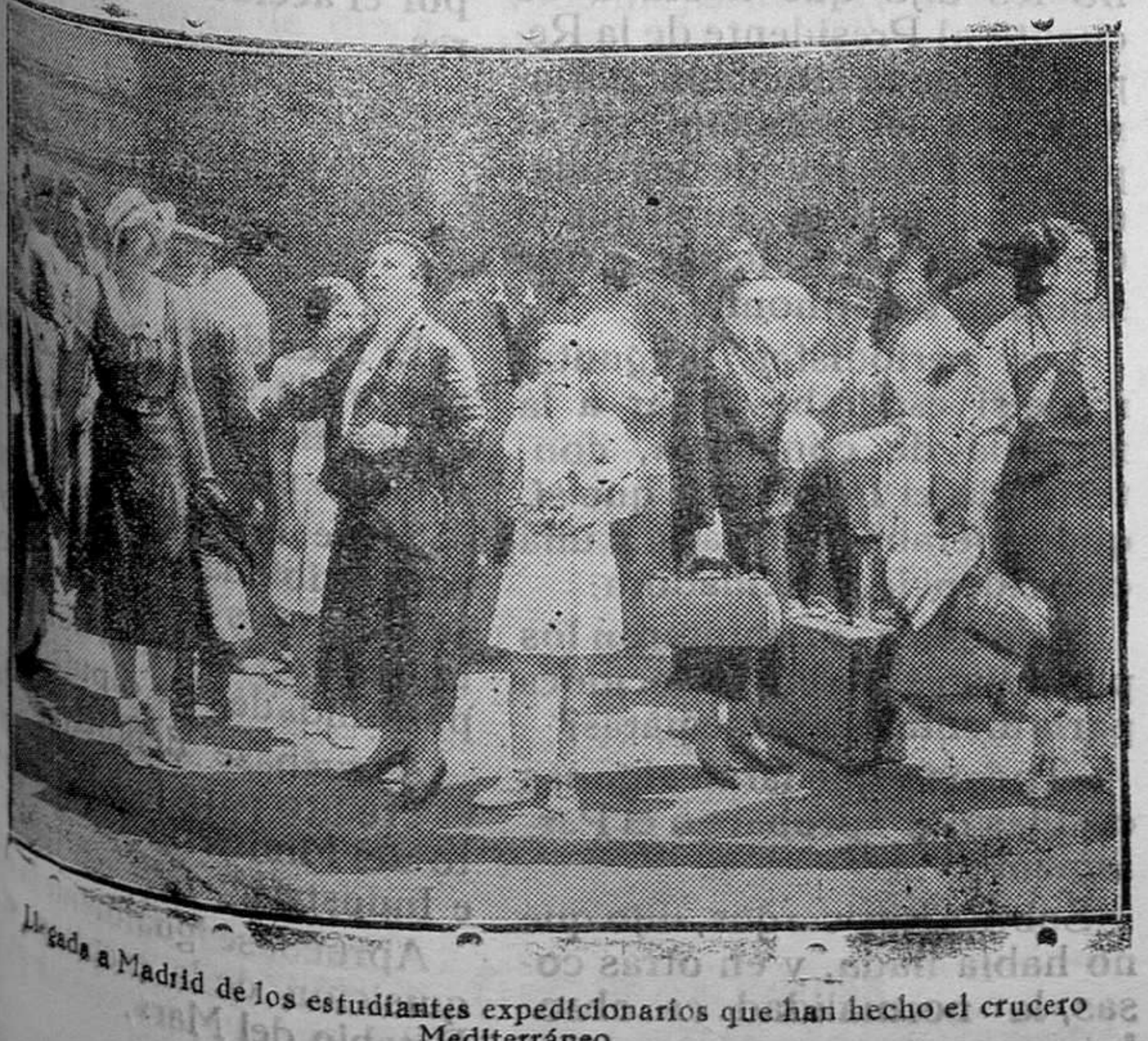
La llegada a Madrid de los estudiantes expedicionarios que han hecho el cruceo Mediterráneo