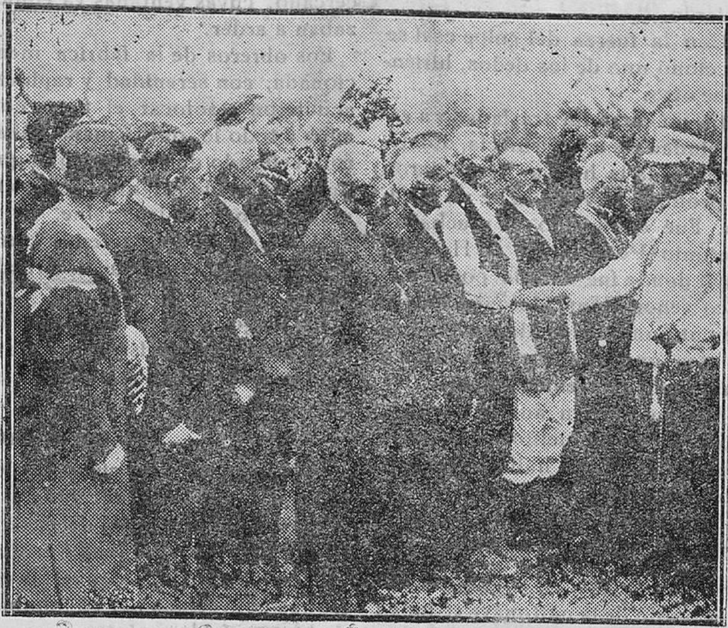
El Rey de Yugoslavia en la visita que actualmente viene haciendo a su país se detiene hasta en las más pequeñas aldeas. En la fotografía se le ve hablando con los vecinos de Gaspe Liea.