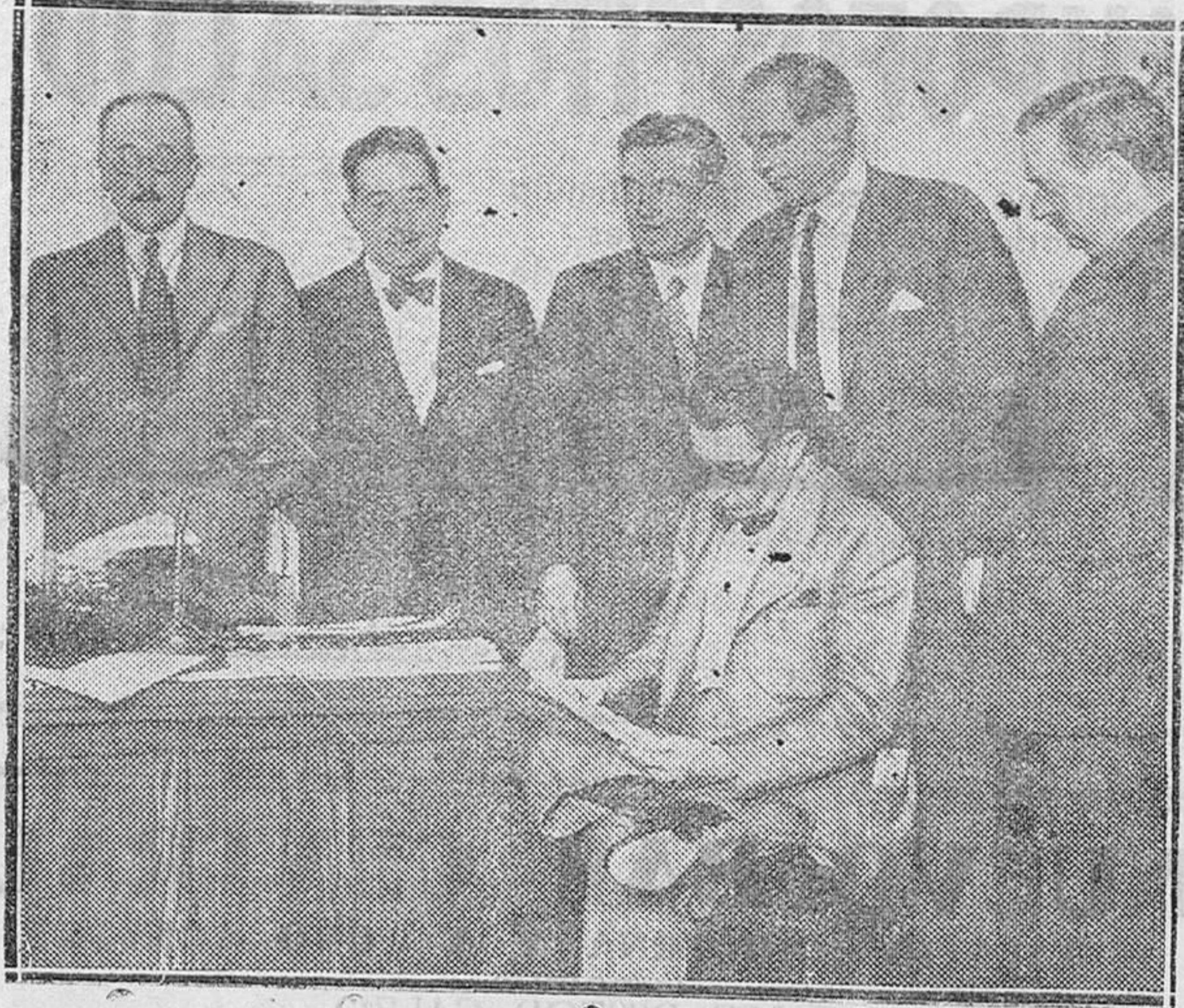
MADRID.—En el Círculo de la Unión Mercantil.—La Junta Directiva al hacerse nuevamente cargo del Círculo abriendo las dependencias que estaban precintadas

Parque del Corazón de Jesús Vendidos en la LAMBERTINI S.A. Calle de San Juan de los Rios 10 Teléfono 100