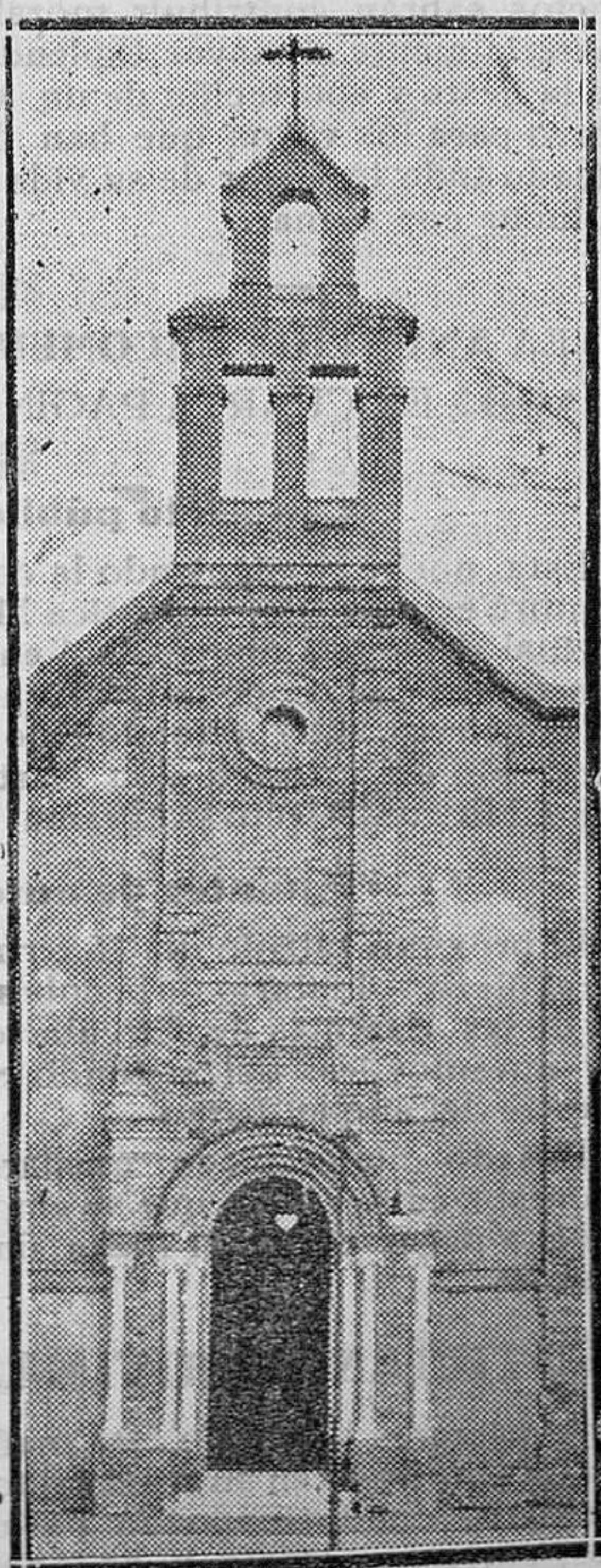
Fachada de la nueva iglesia de Casas Viejas. — Ha podido abrirse al culto el nuevo templo, cuyas funciones inaugurales congregaron en él a todo aquel pueblo que supo de los mayores infortunios y más acerbos dolores

No dejaremos de consignar aquí un pormenor elocuente que puede demostrar hasta que punto la austeridad de la vida privada de los hombres públicos viene a ser una magnífica aliada de los triunfos políticos. A Irigoyen le llamaban en su país «el viejo peludo», por la