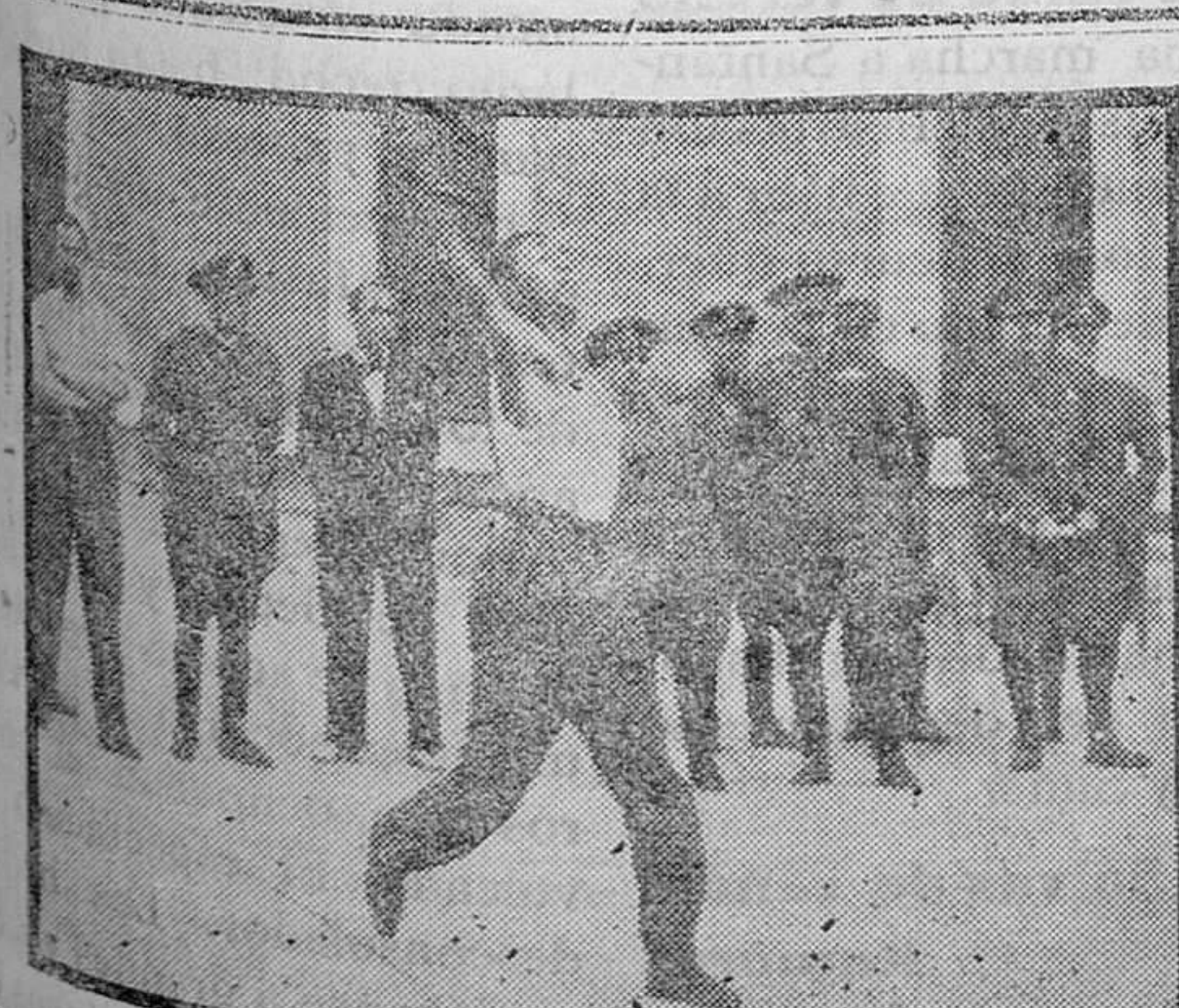
CONCURSO NACIONAL DEPORTIVO MILITAR. — Lanzamiento de granadas, tercera prueba del concurso celebrado en el cuartel de la Montaña

Para dar cumplimiento a esta disposición, quedan convocados para la elección respectiva, en es-