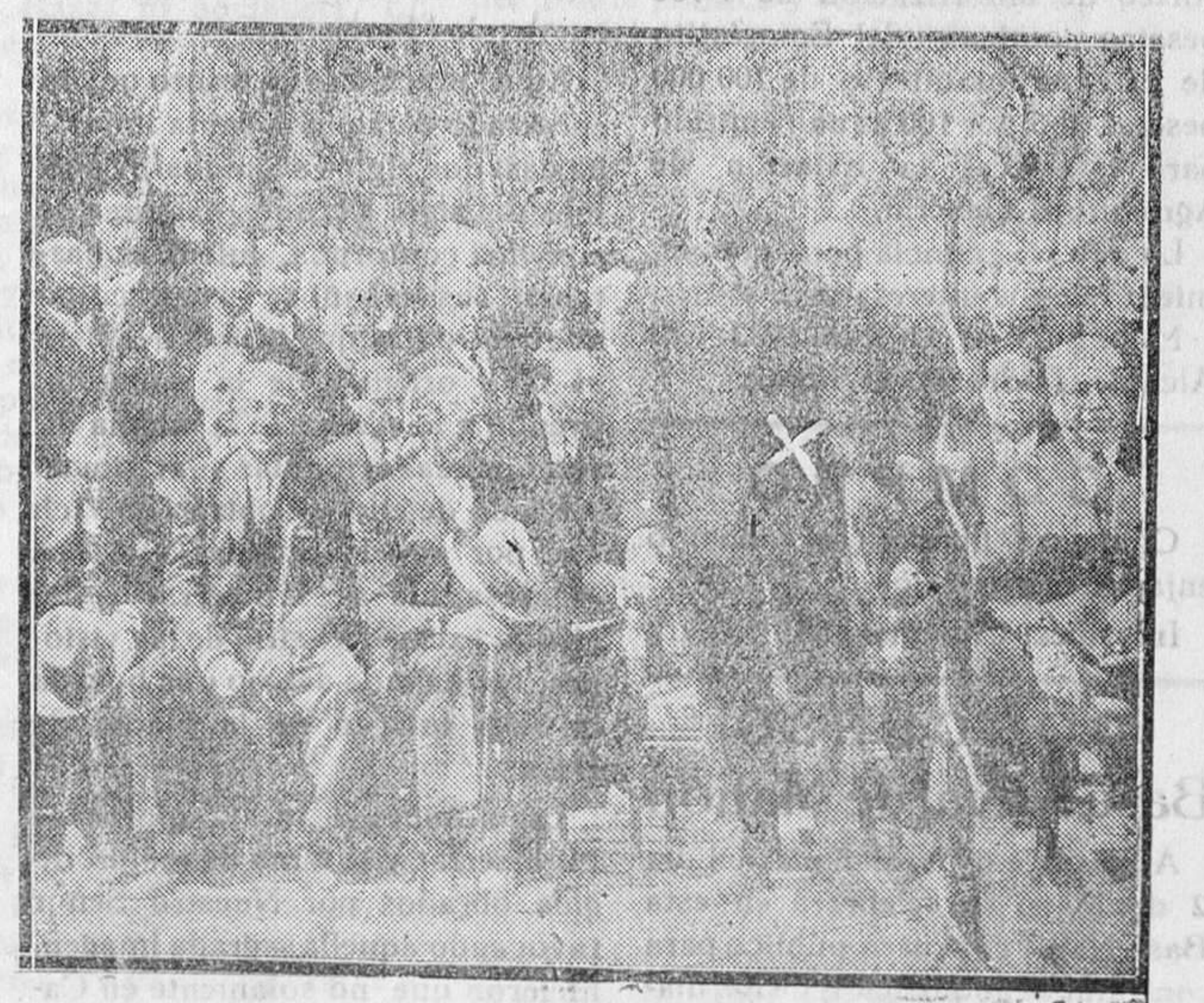
MADRID. — El señor Alcalá Zamora, Presidente de la República, rodeado del Gobierno, en el discurso que pronunció en la inauguración del nuevo trozo de empalme en la Castellana e Hipódromo

los billetes de Banco y que suban los precios. Pero, por otra parte, si suben los precios, los Estados Unidos no podrán exportar más barato que ahora; es decir, que no podrán rivalizar con Inglaterra que sigue vendiendo a los mismos precios, a pesar de que el valor de la libra esterlina haya bajado en un treinta por ciento. Como los precios siguen siendo los mismos, no hay en Inglaterra amenaza de inflación (no se necesita para vivir más dinero que antes), mientras que el porvenir financiero de Norteamérica aparece bastante incierto. UN DIPLOMATICO (De «Las Provincias»).