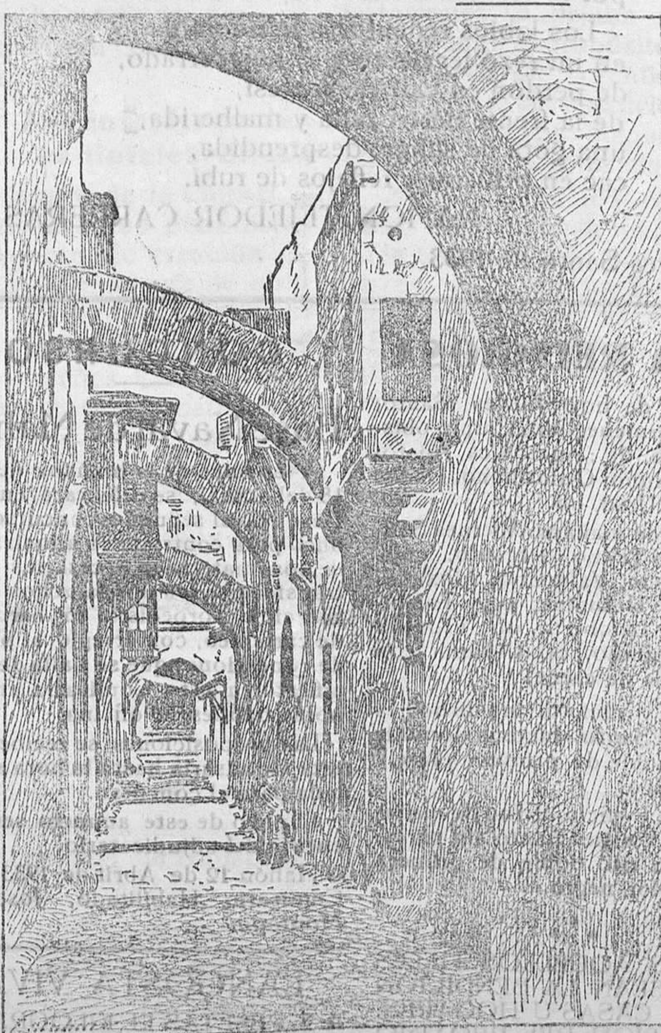
LA VÍA DOLOROSA O CALLE DE LA AMARGURA Tomado del natural por el distinguido dibujante señor Escobar