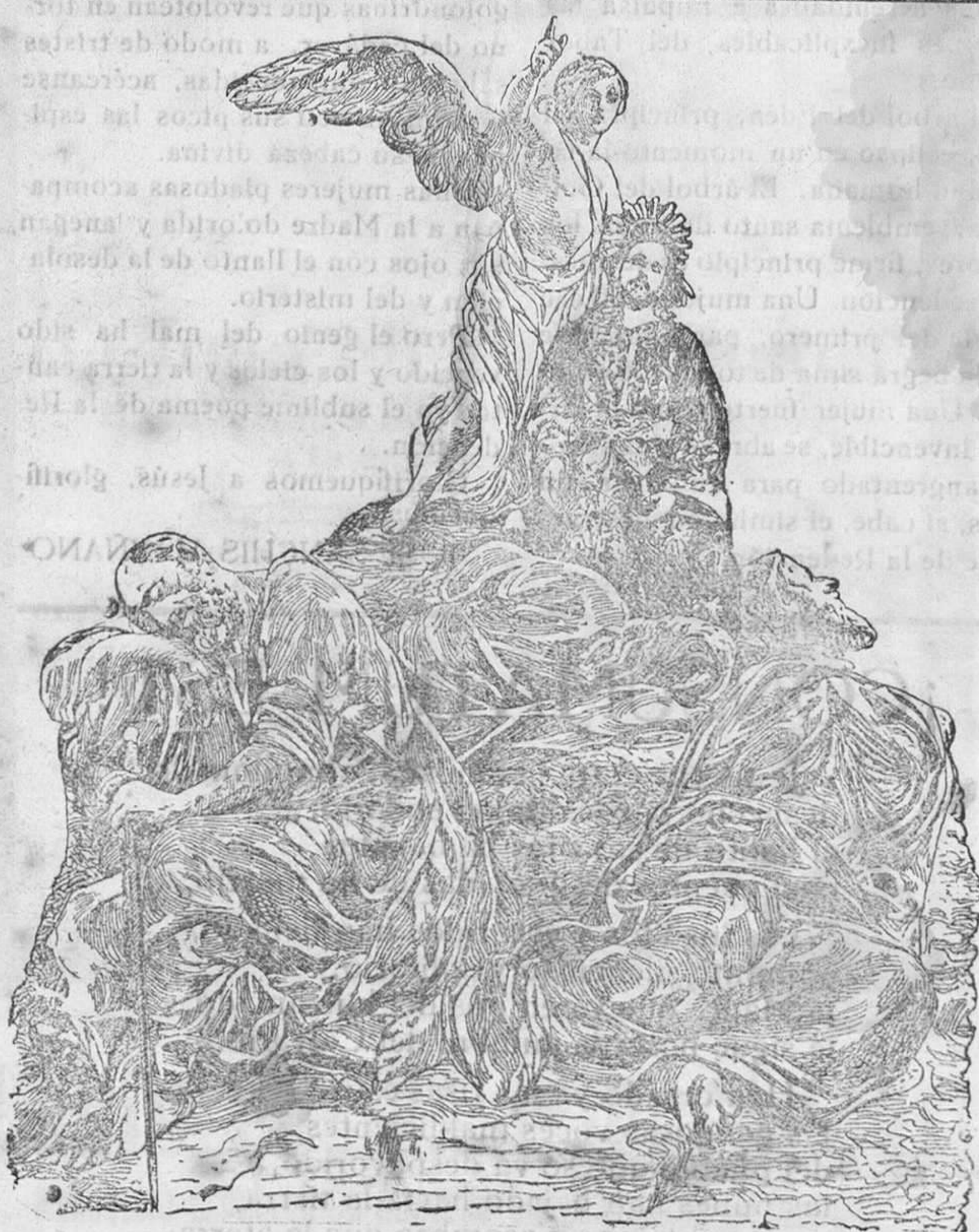
LA ORACIÓN EN EL HUERTO Famosa escultura existente en la Catedral de Murcia, obra del escultor Salcillo