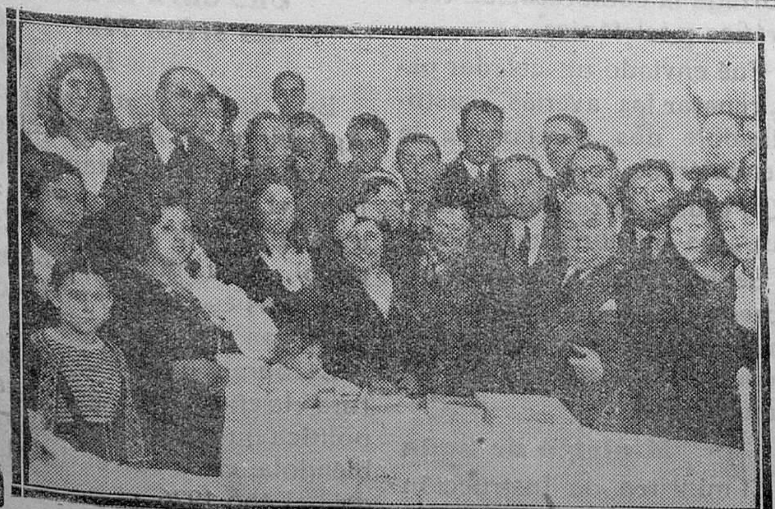
MADRID.—El Alcalde de Madrid don Pedro Rico y diferentes personalidades durante la entrega de juguetes a los niños del Asilo del Niño Jesús, con motivo de las fiestas de Navidad y Reyes

Mahón, a 11 de enero de 1933.—El Alcalde-Presidente, Pedro Pons Siyes.