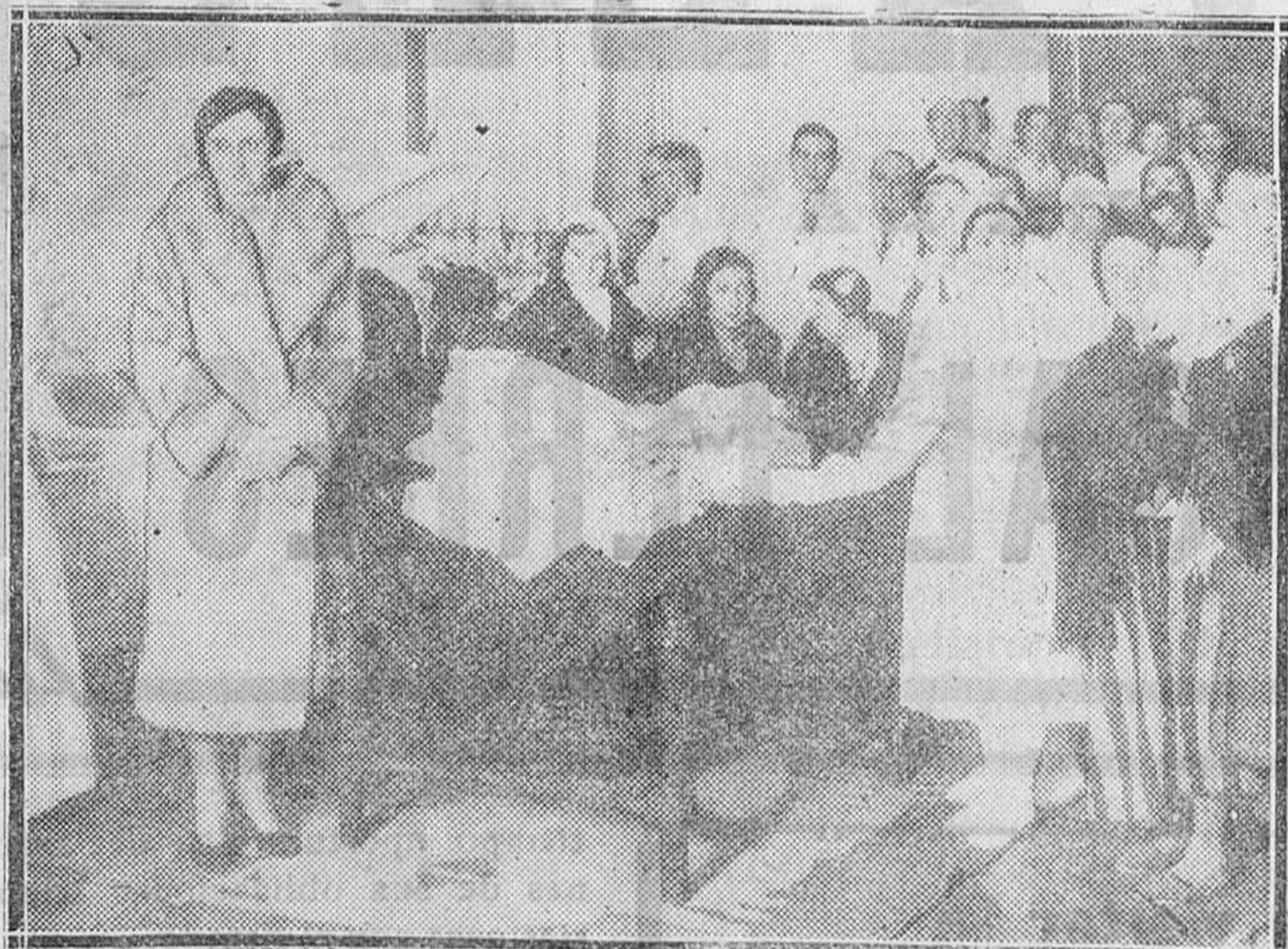
MADRID.—Reparto de ropa en la Casa de Salud de Santa Cristina a los niños que nacieron durante el año 1932 en dicho establecimiento benéfico