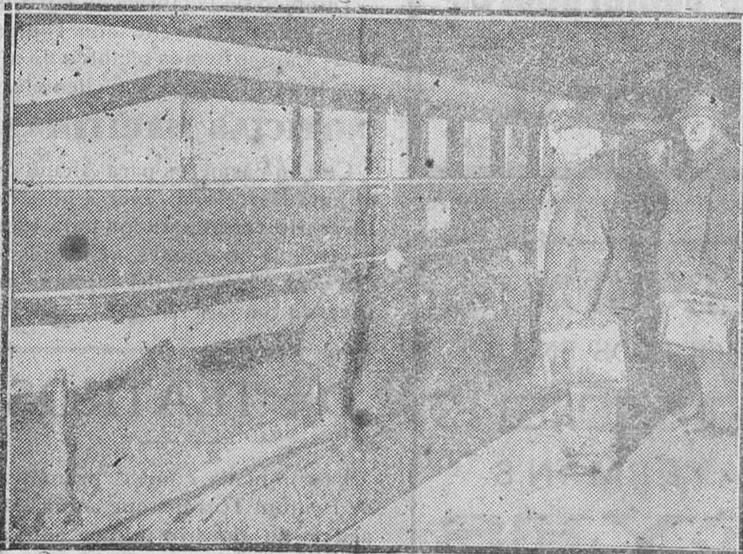
BERLÍN.—Ensayo de un tren eléctrico entre Berlín y Hamburgo, haciendo el recorrido en 142 minutos, batiendo el record que estaba en 180 minutos. En la foto el nuevo tren en la estación de Berlín