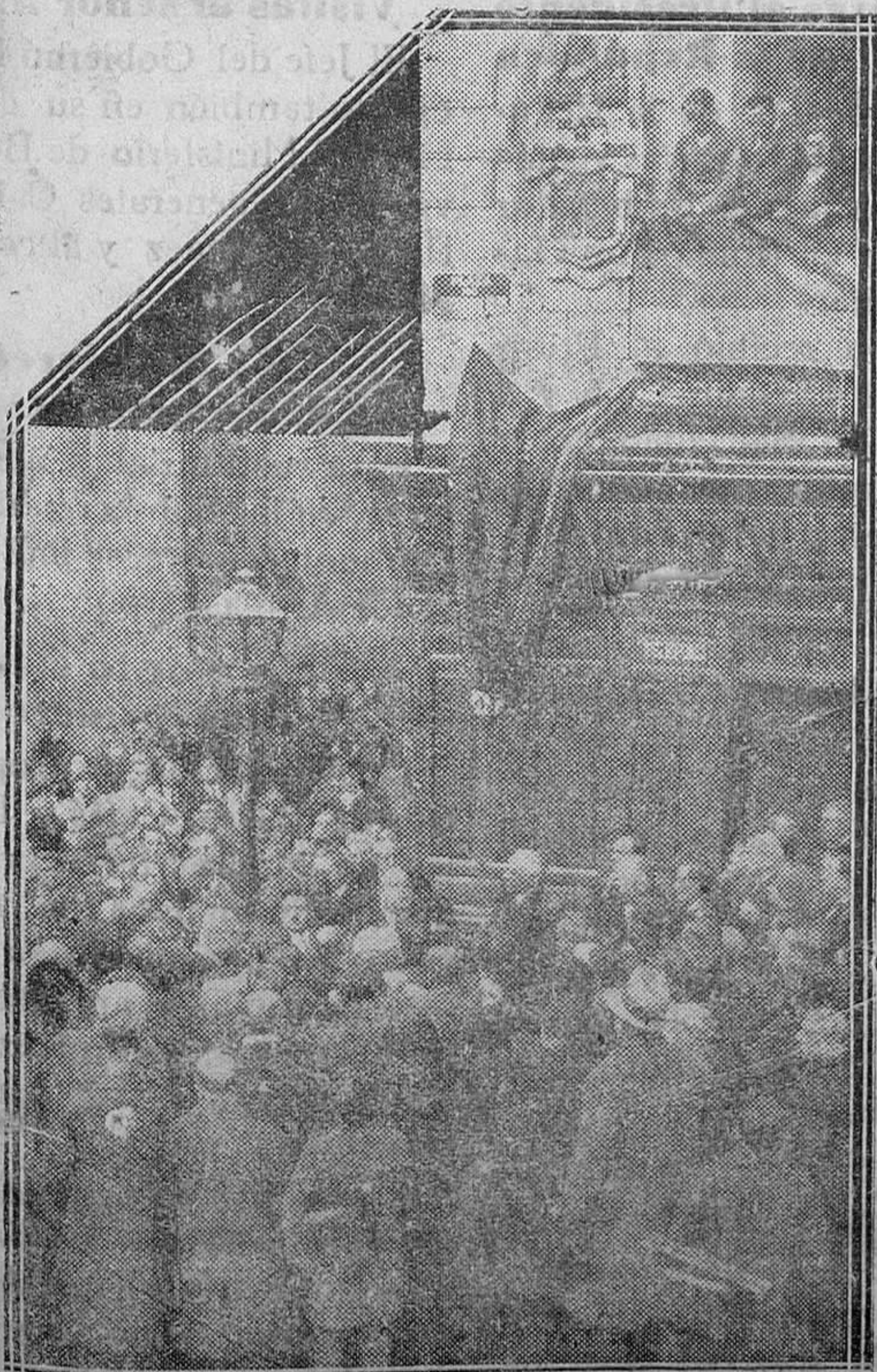
MADRID.—Descubrimiento de la lápida que da el nombre de Romero de Torres a la antigua plaza de los Carros con asistencia de distinguidas personalidades

Los dueños, Directores, Gerentes o Administradores de Empresas o Sociedades que tengan contrato con el Estado, las Provincias o Municipios, si admiten a su servicio individuos que no se encuentren, con relación, al servicio militar, en las condiciones legales co-