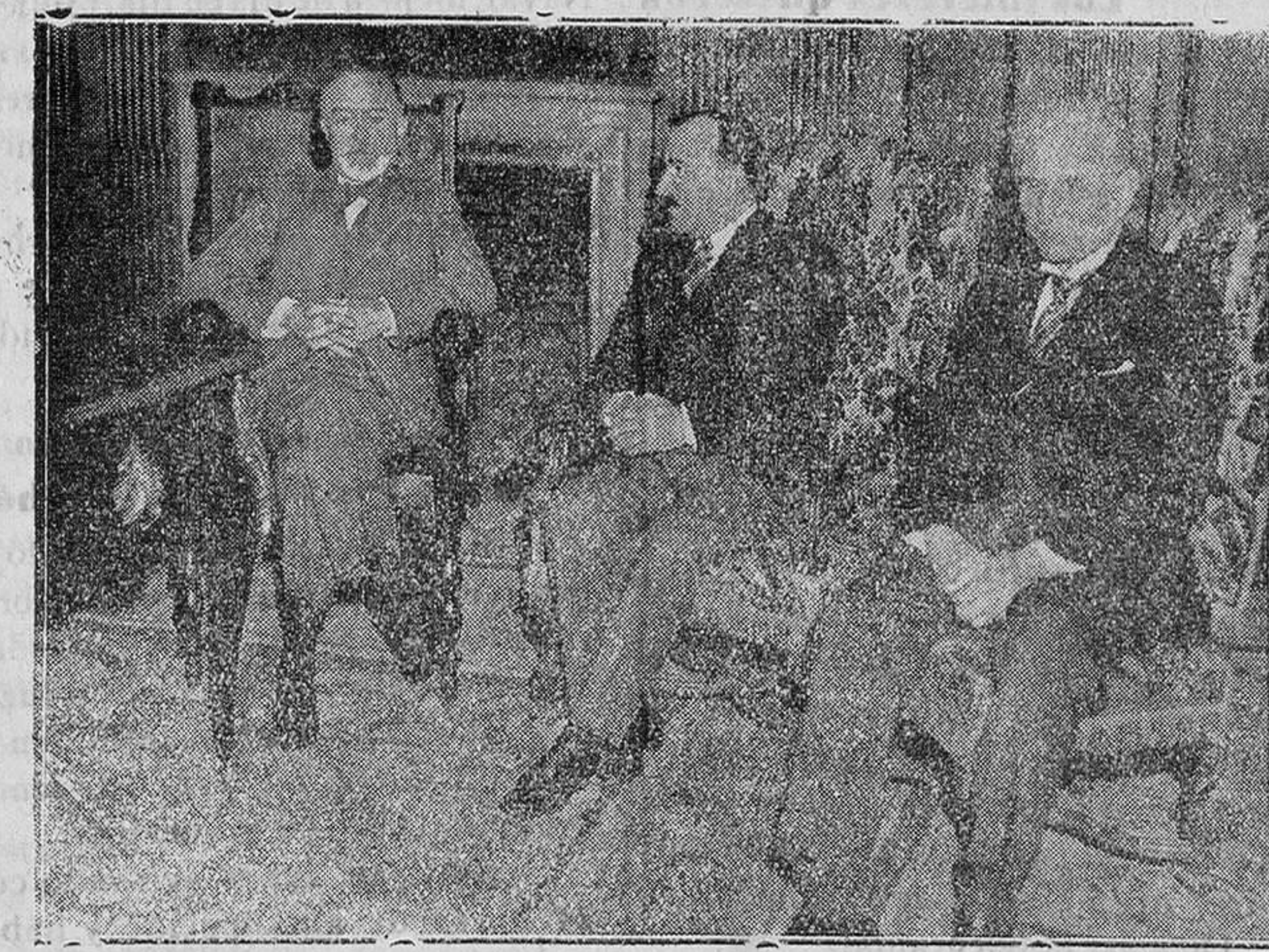
MR. JEVITCH EN EL QUAI D'ORSAY. — Mr. Jevtitch, ministro del Exterior de Yu- goslavia, ha llegado a París, donde ha sido recibido por Mr. L. Barthou