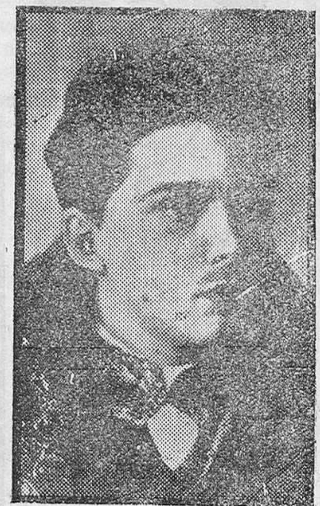
El príncipe Otto de Habsburgo, pretendiente al trono de Austria

que perteneciente al patrono, cobren. Para coaccionar a los obreros, no tiene sino que echarlos de la organización o acordar que no perteneciendo a ella, no trabajen en ningún sitio. Y, en fin, supremo argumento: el Estado rebelde socialista mantiene implantada y aplica por medio de sus Juventudes y de sus sicarios la pena de muerte. El asesinato político o social es la pena de muerte aplicada por el Estado socialista a quien lo desacata. El terror que tratan de imponer los pistoleros socialistas es la forma de coacción que emplea el Estado rebelde socialista. Un Estado dentro del Estado. Con su ejército de pistoleros, con su presupuesto cobrado por la fuerza y administrado sin garantía ninguna de publicidad ni de licitud, con su aristocracia de mandamados, con su pena de muerte impuesta y aplicada sumariamente.»