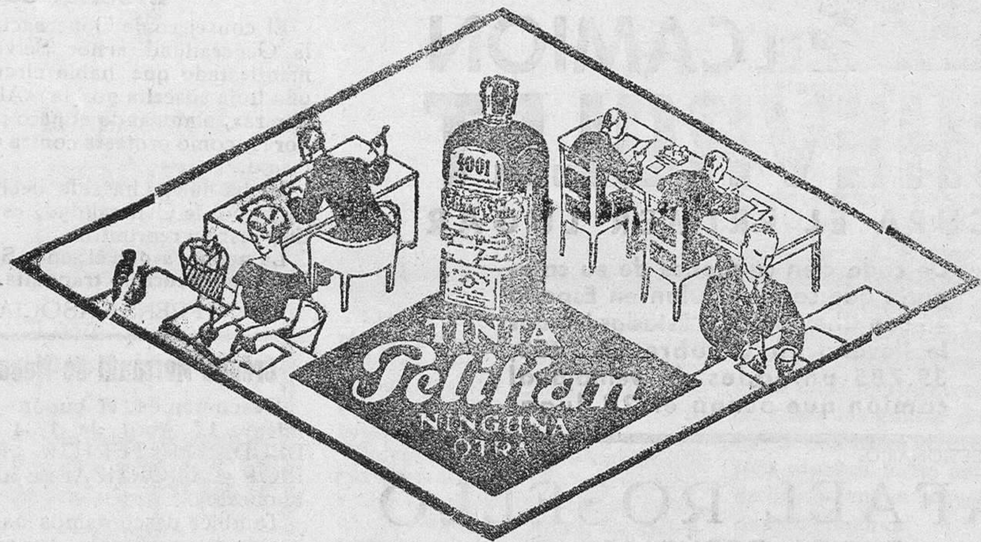
De venta en la Librería de Manuel Sintes Rotger, plaza de Pablo Iglesias 17, Mahón

SORDOS Esta molesta dolencia que le impide alternar en sociedad, con la intensidad debida, que le priva del placer de escuchar el concierto, el canto de un artista, el sermón del orador sagrado, el discurso del líder, la voz de la persona amada, puede combatirse fácilmente hoy, gracias a los excelentes aparatos AUDISON Adquiera Ud. uno y oirá perfectamente. Recomendamos nuestro tamaño invisible y graduable. Los tontos de oído y los sordos que no lo sean de nacimiento, no deben desconfiar de poder oír con estos aparatos, por ser los más cómodos, los más perfectos, los de mayor potencia auditiva. Todo sordo debe probar estos nuevos aparatos y se convencerá de que no se trata de una mera propaganda. Nuestro lema es: No compre si no oye. Ensayos y demostraciones gratis en: CIUDADELA. - Martes 13 Marzo, Fonda Feliciano. FERRERIAS - Jueves 15 Marzo, Fonda Marcos Moll. MAHON. - Sábado 17 Marzo, Hotel Bustamante. Institución Medical de Ortopedia «Orim» Rambla de Capuchinos, 11. - BARCELONA