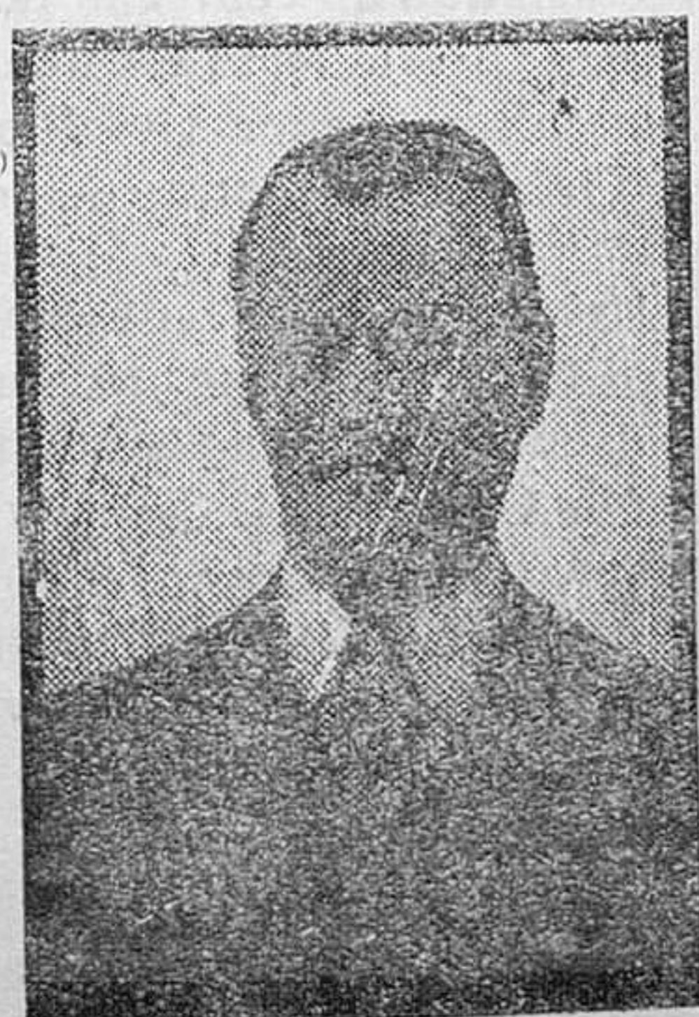
El actual Embajador norteamericano en Cuba Mr. Jefferson Caffery

No hay, pues, que extrañar la conducta seguida por el socialismo desde que fué apartado del Poder y derrotado electoralmente, porque a una derrota equivale la situación a que ha quedado reducido en la Cámara.