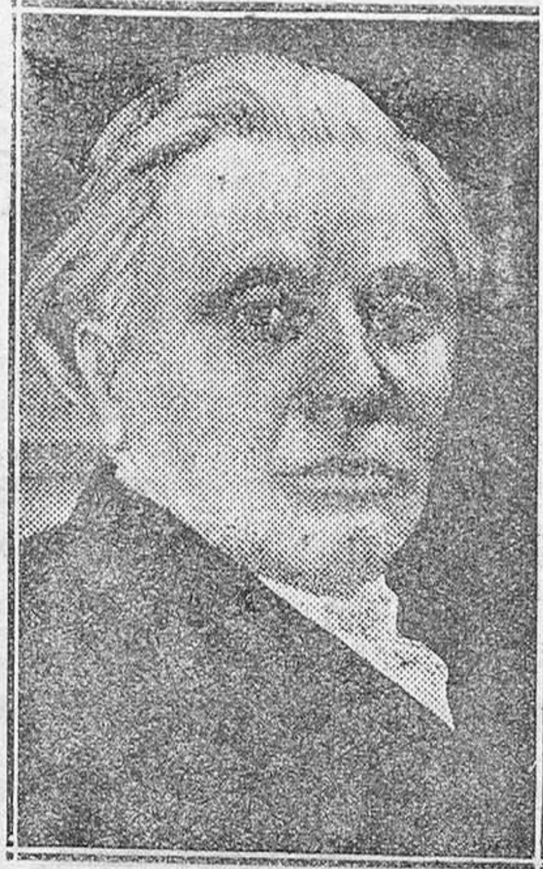
PARIS. — Monsieur Paul Boncour que ha pronunciado un discurso en el que se ha referido a todos los problemas exteriores actualmente planteados

«El Gobierno del país está materialmente en nuestras manos, y nadie nos lo arrebatará si nos negamos a abandonarlo. Las fuerzas no secundarán otra iniciativa que la que nosotros dictemos desde nuestros respectivos departamentos. Es fácil que se dé algún chispazo de indisciplina; pero como tampoco ignoramos de dónde puede surgir, la sorpresa no nos cogerá des-