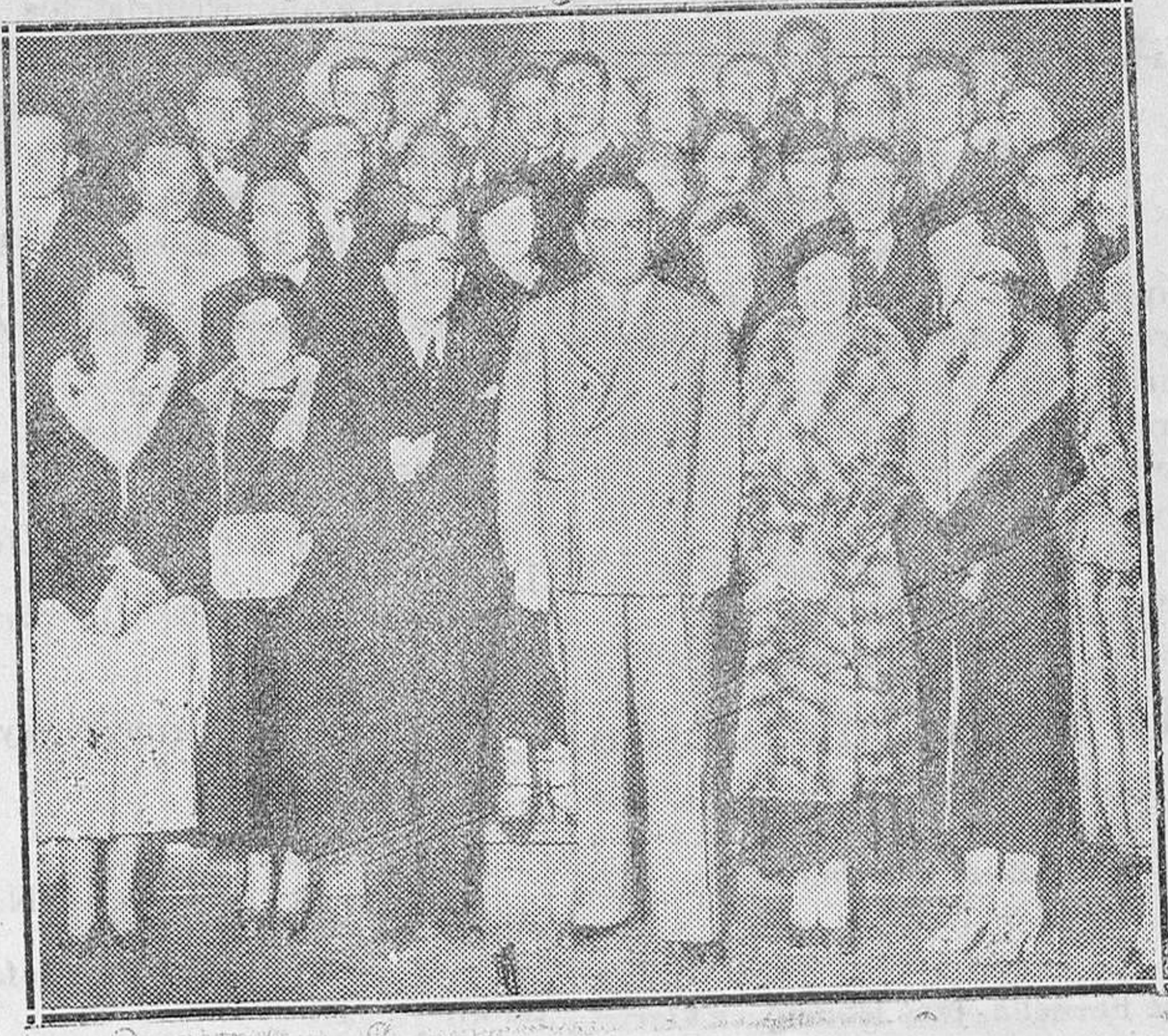
MADRID. - Puerto Rico y España. - Homenaje celebrado en el Hotel Nacional en honor de los estudiantes puertorriqueños