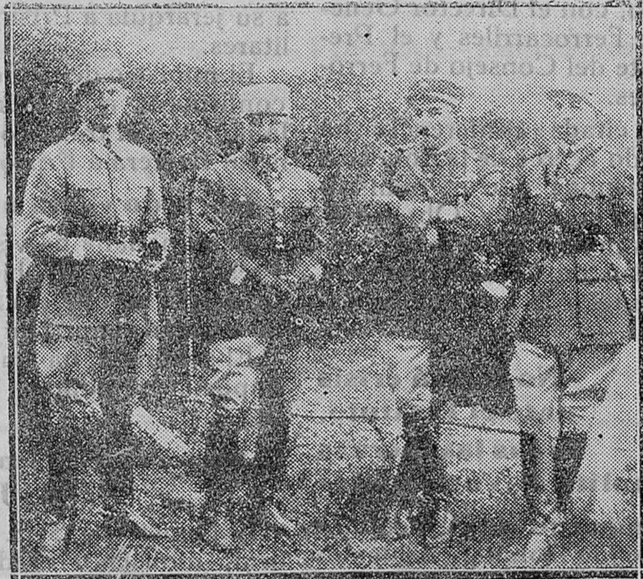
El equipo francés que tomó parte en el Concurso Hípico verificado en Madrid en el Hipódromo de la Castellana

Es de creer, que esa política se rectificará en los presupuestos sucesivos. Y así puede deducirse de las palabras que pronunció el señor Alcalá Zamora cuando visitó los Astilleros de Cartagena y de las manifestaciones hechas por el