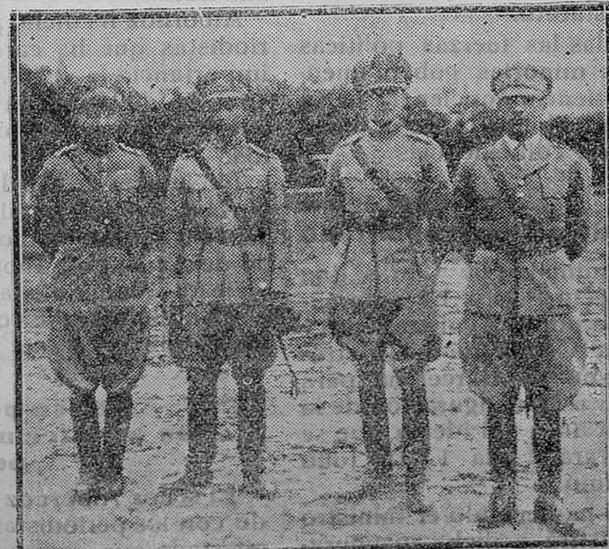
El equipo portugués que tomó parte en el Concurso Hípico verificado en Madrid en el Hipódromo de la Castellana