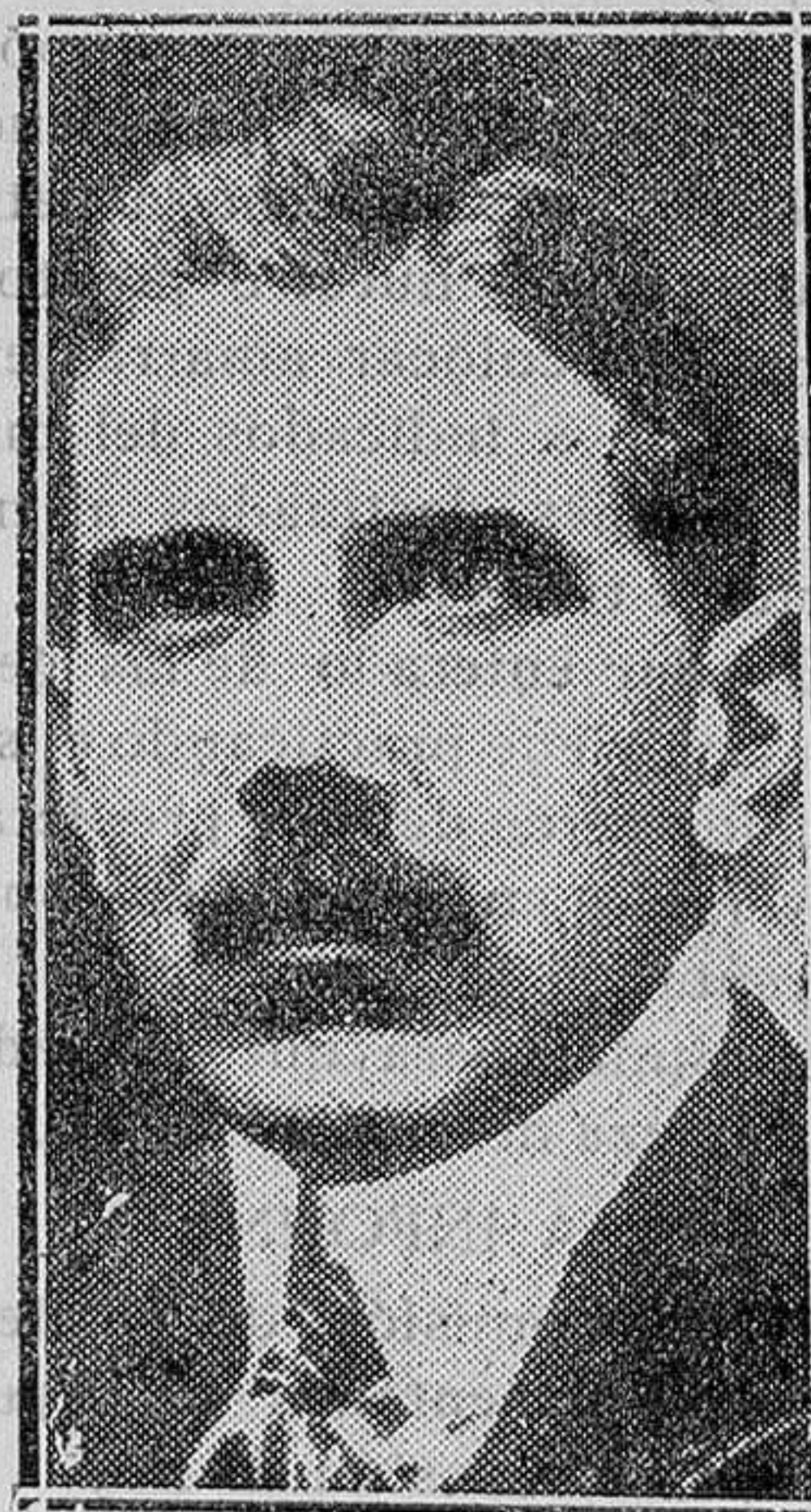
El nuevo canciller alemán, von Pape, de partido conservador católico