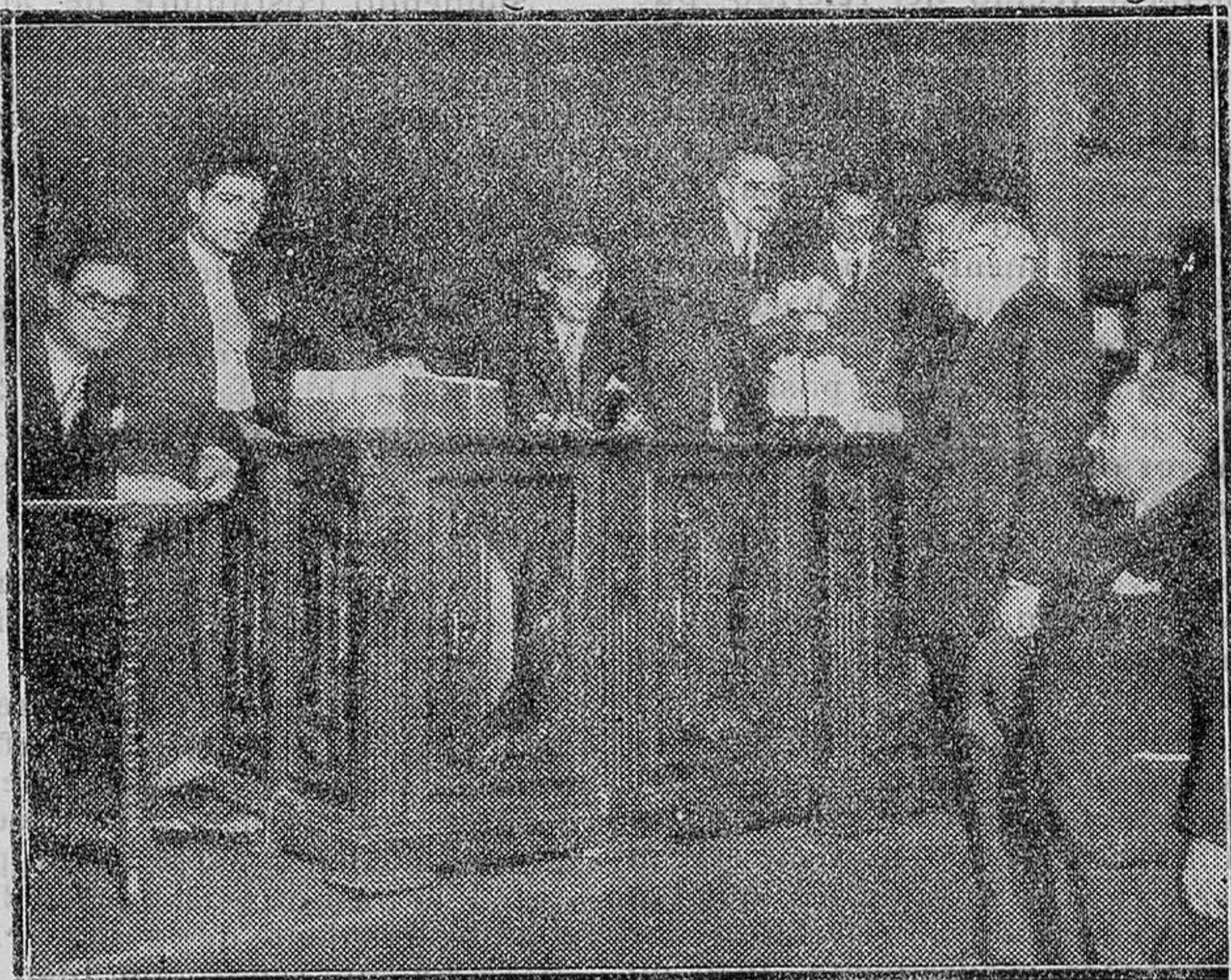
MADRID.—Votación para Presidente de la Junta del Ateneo.—El señor Azaña, que hasta ahora ocupó dicho cargo, al emitir su voto