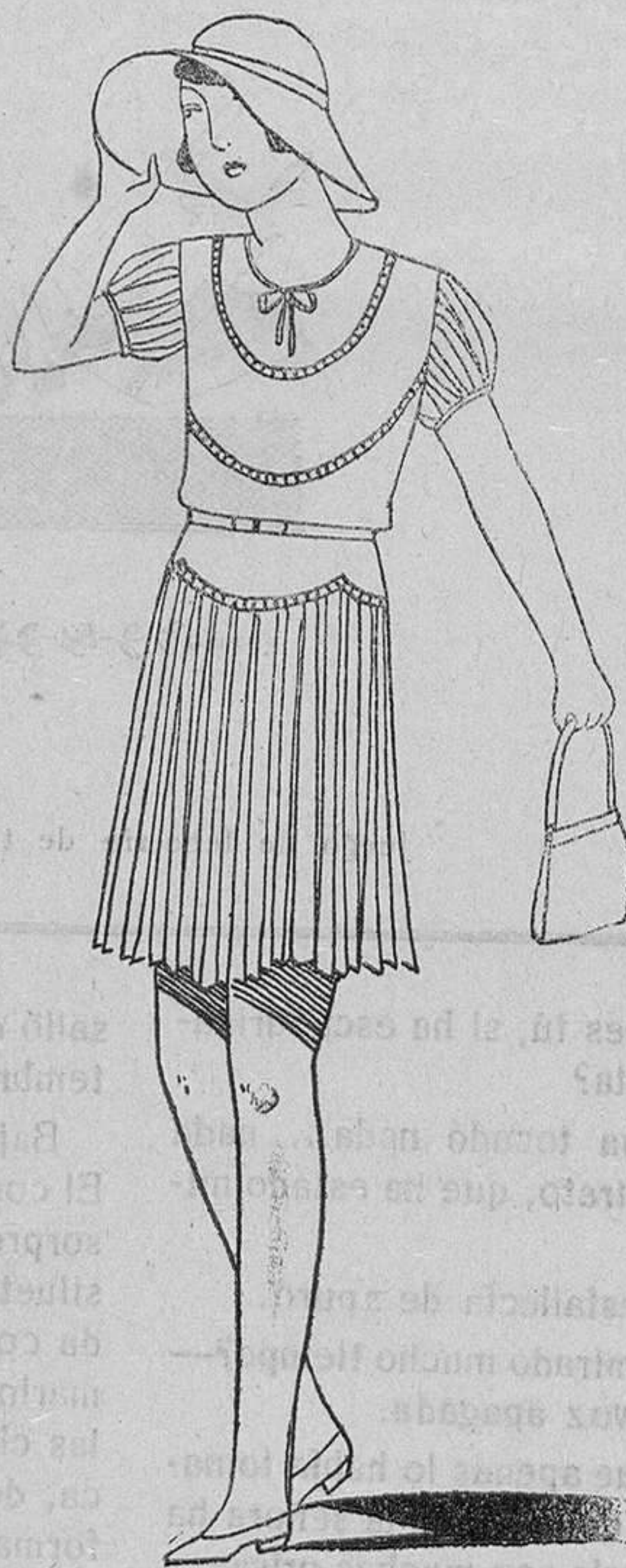
Vestidito de crepé verde pálido, con la falda y las mangas plisadas