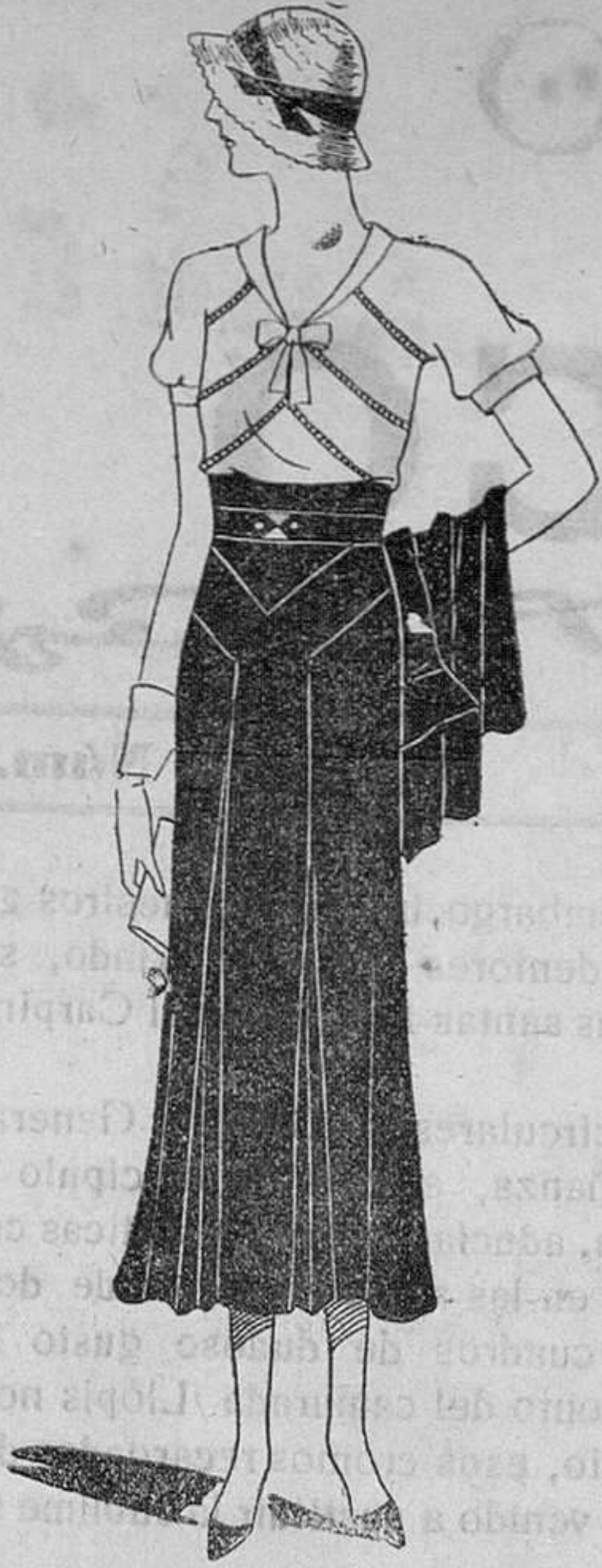
Blusa de crepé blanco, adornada con jours y falda de crepé marocain marino