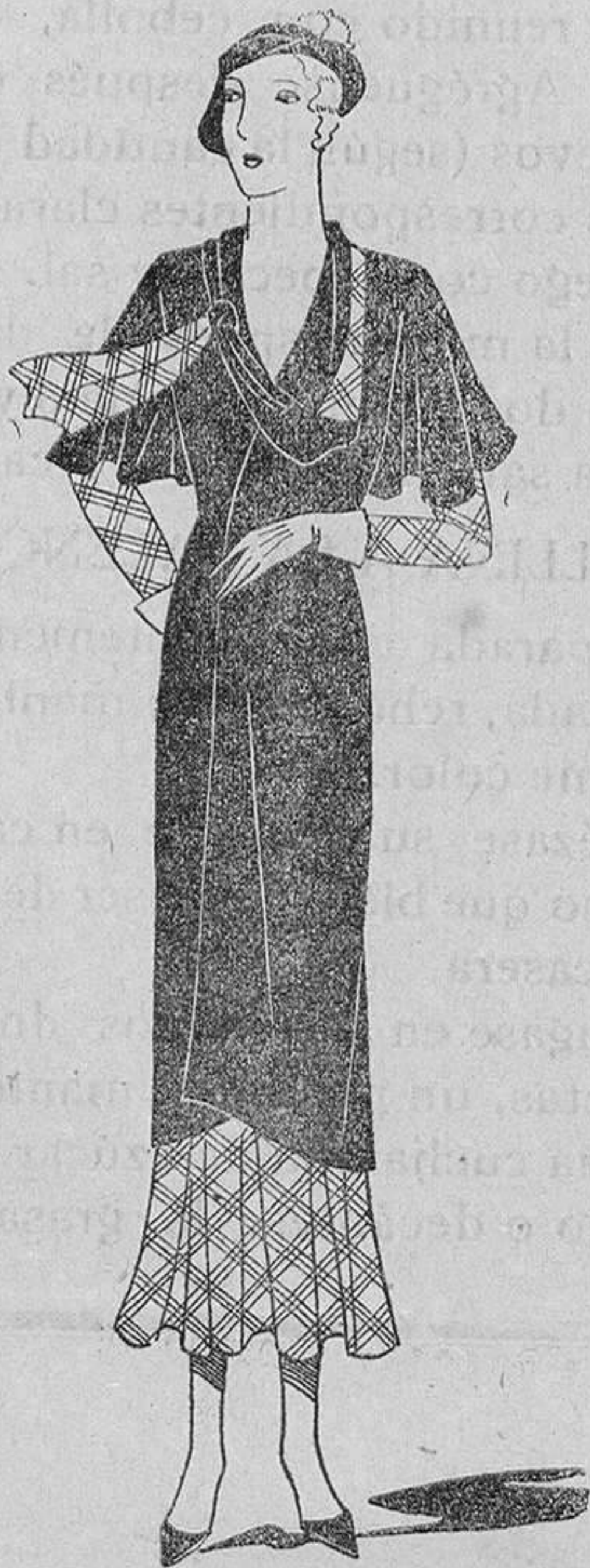
Abrigo de crepé azul marino, sobre un vestido de crepé de china a cuadros azules y blancos