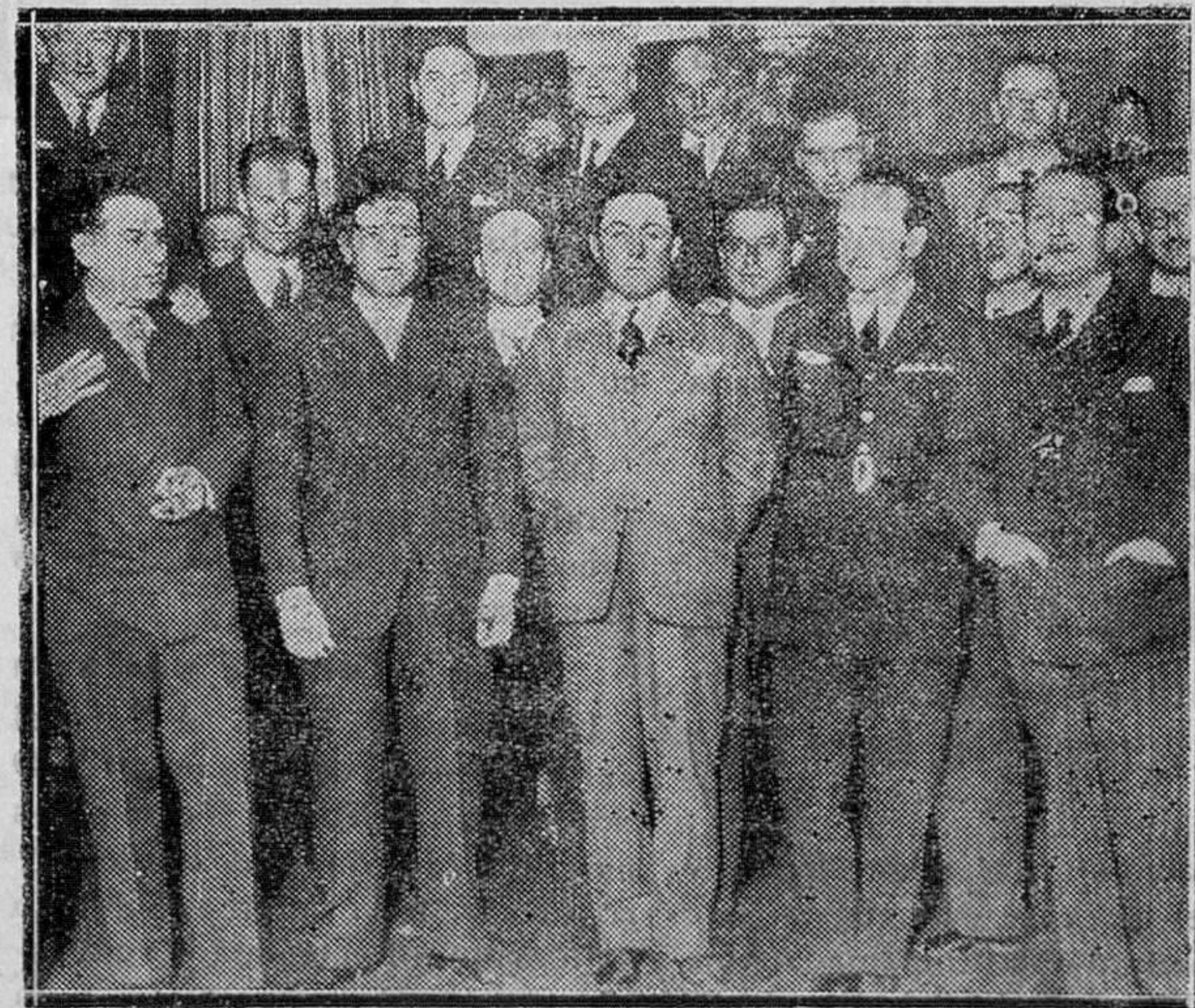
MADRID.—En el Aero Club fué obsequiado con un vino de honor el ilustre aviador Mr. Costes