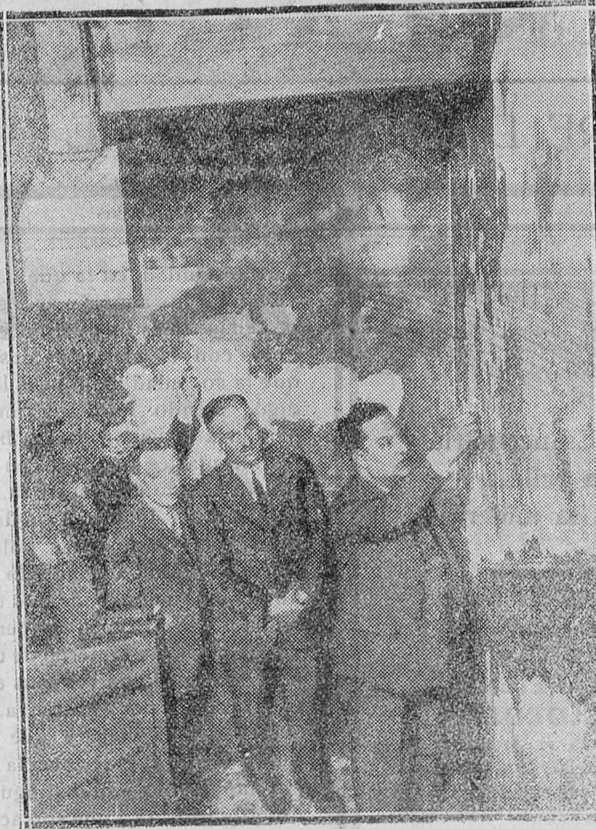
MADRID.—El Alcalde de Tetuá, viéndolo los desperfectos ocasionados por el incendio en el local del Ayuntamiento a causa de la suspensión de un mitin comunista.