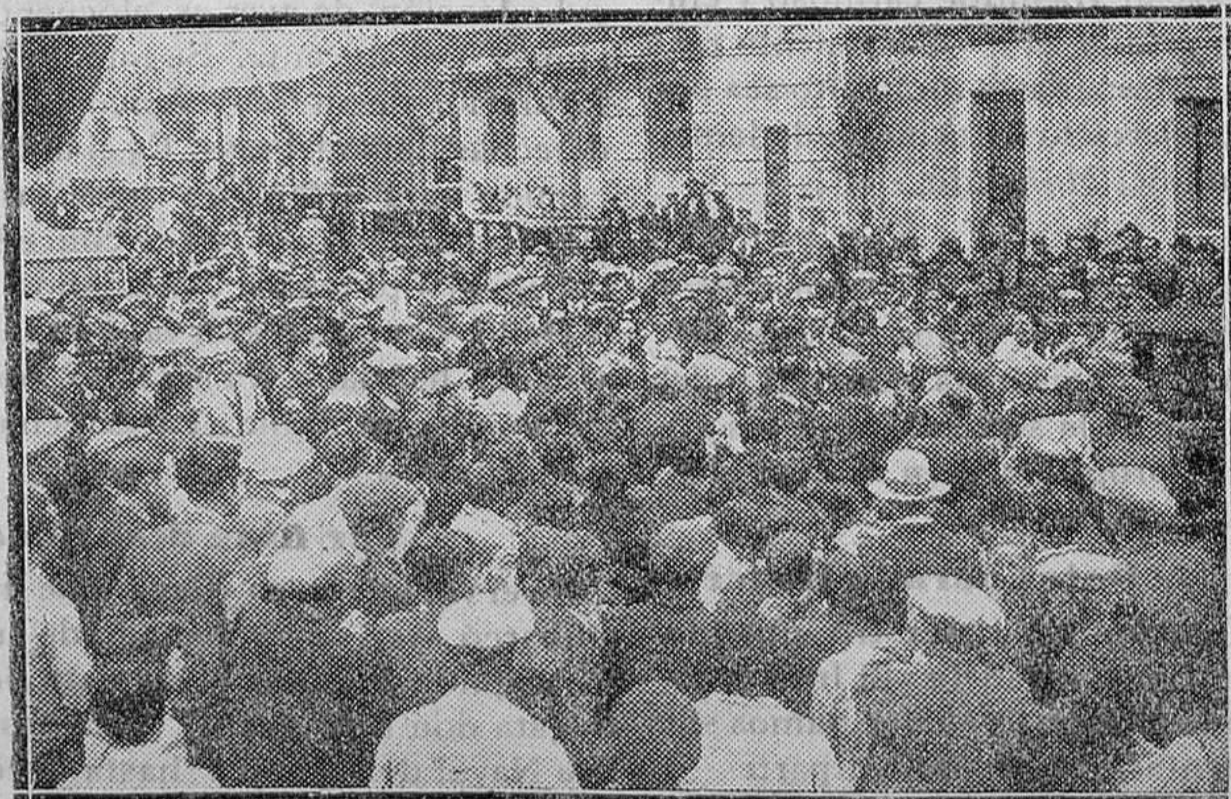
El público saliendo de una conferencia dada en San Bartolomé de Llobregat por el ingeniero de la Hidrográfica del Pireneo Oriental, en defensa del proyecto del pantano de Calnianas, que resolvería el problema del riego y evitaría los perjuicios de las inundaciones que tanto daño causan en la comarca.

Concretamente, volvemos a señalar la penosa situación del comercio español, sobre el que han caído muchísimas desdichas; por ejemplo, aumento de contribución; merma considerable de ingresos, por la aplicación—que es antisocial y antieconómica en este aspecto—del cierre absoluto los domingos; disminución de la jornada mercantil, en momentos de general agobio; elevación de los salarios a la dependencia, y otra serie de gabelas, que no es preciso enumerar. Pues bien: como si no fuera bastante, ahora viene la cada ley de utilidades que por obra y gracia del señor Carner, alcanza incluso al comercio individual. Y a nosotros, y a quien vea serenamente las cosas, nos parece demasiado. Porque esa ley, grava el esfuerzo