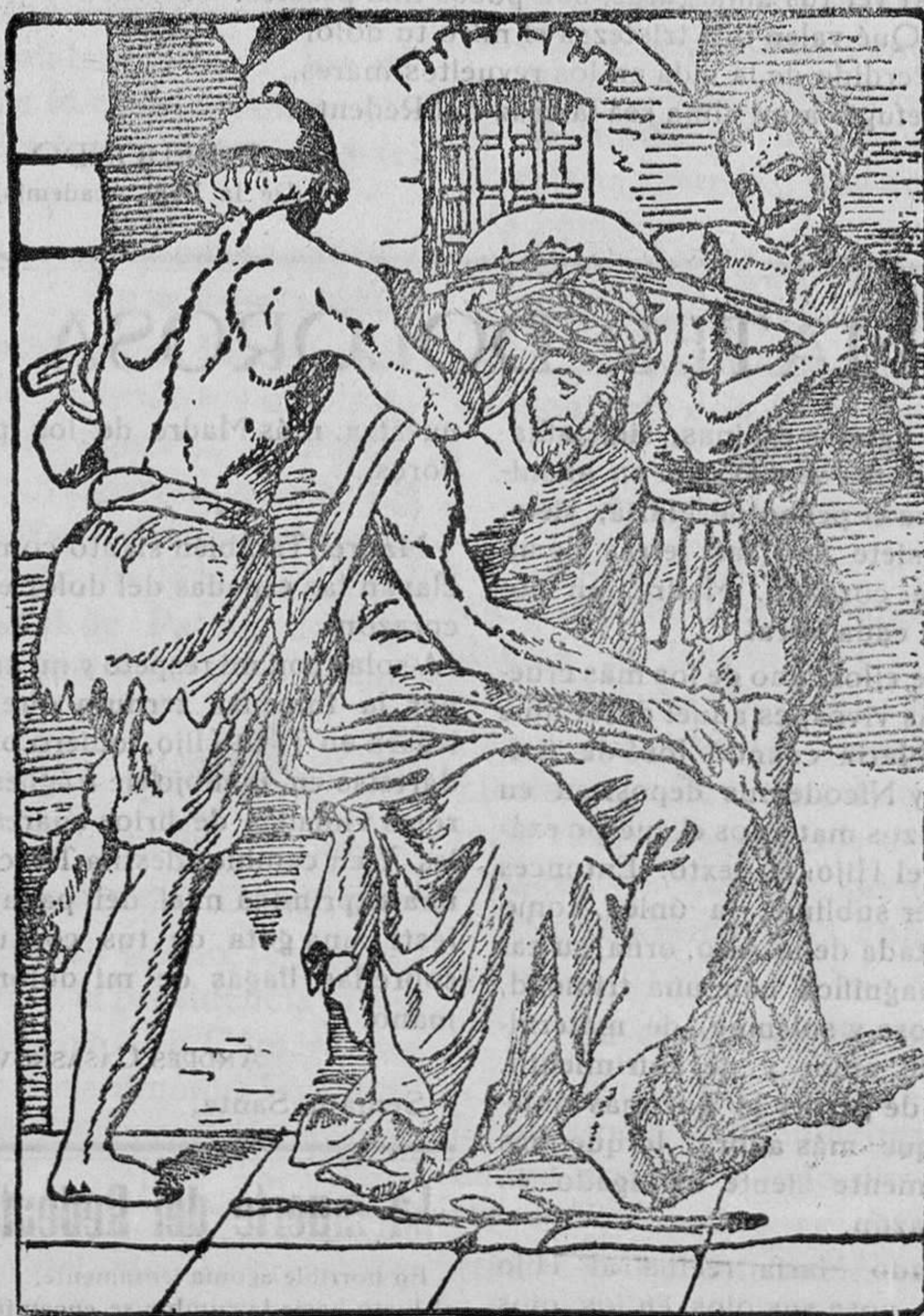
«Y tejendo una corona de espinas, se la pusieron en la cabeza, y una caña en la mano derecha». — (Math. XXVII).