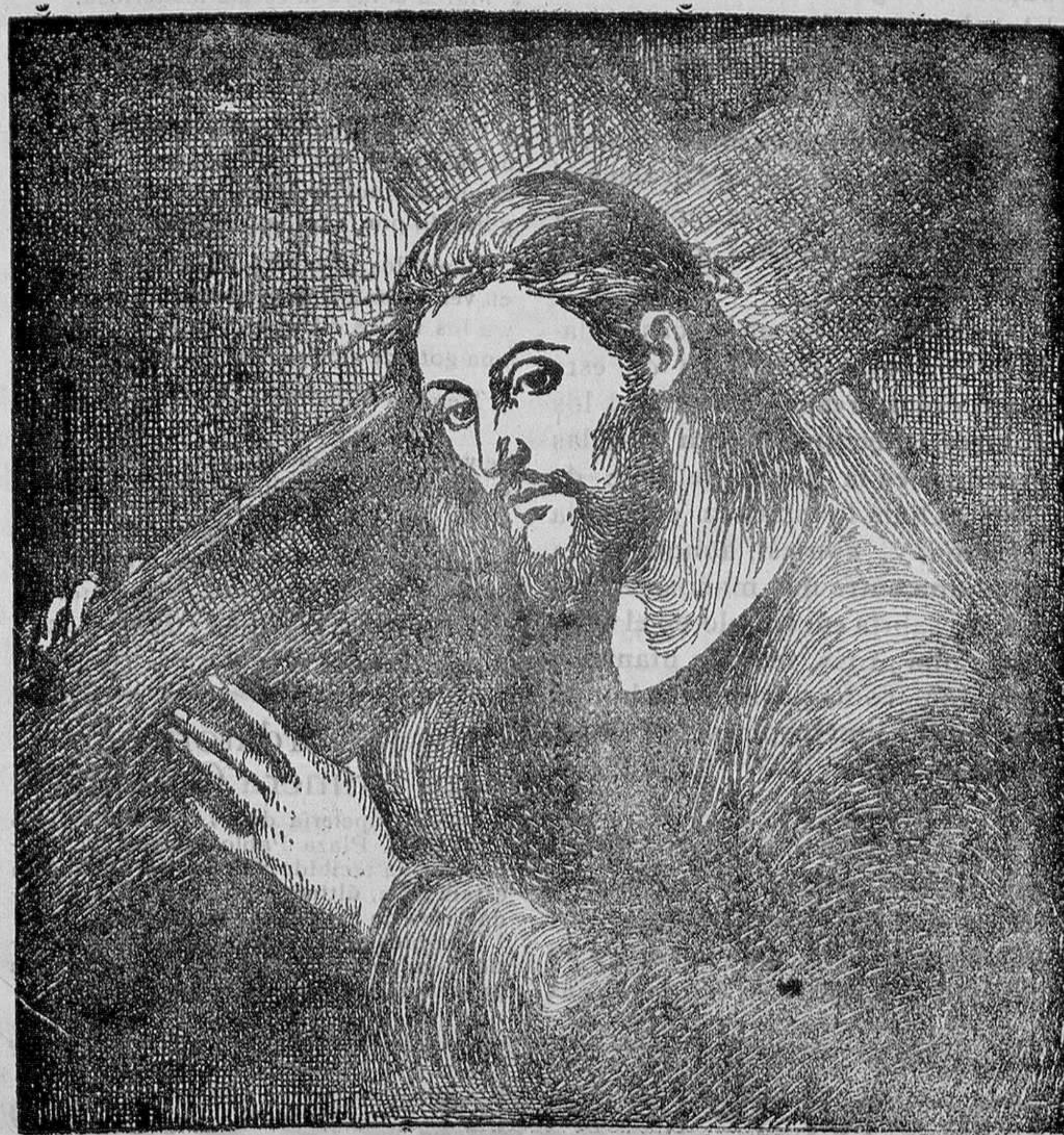
JESÚS CON LA CRUZ

—«¿Tu eres el Maestro de Israel y no sabes esto? En verdad, en verdad te digo que lo que sabemos hablamos, y lo que hemos visto atestiguamos, y no recibimos nuestro testimonio. Si os he dicho las cosas terrenales y no creéis, ¿cómo si os dijera las celestiales creeréis? Y nadie ha subido al cielo, sino el que bajó del cielo, el Hijo del hombre que está en el Cielo, y como levantó Moisés la serpiente en el destierro, así es menester que sea levantado el Hijo del hombre, a fin de que todo el que crea en Él no perezca, sino que tenga vida eterna.»