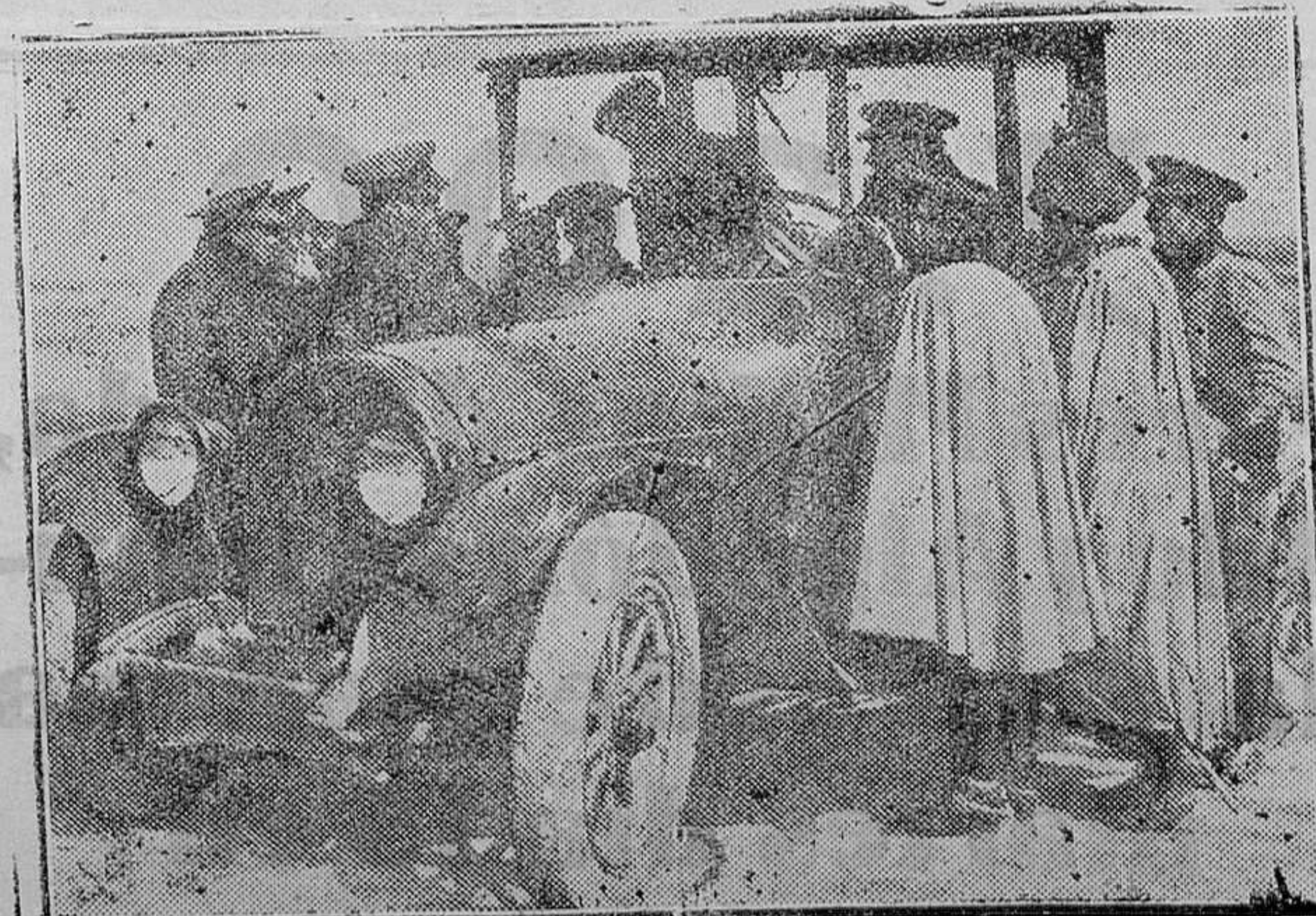
MADRID.—Escuela de tiro del Campamento.—Curso para oficiales de carros ligeros de combate. Los oficiales recibiendo lecciones de mando de coches.