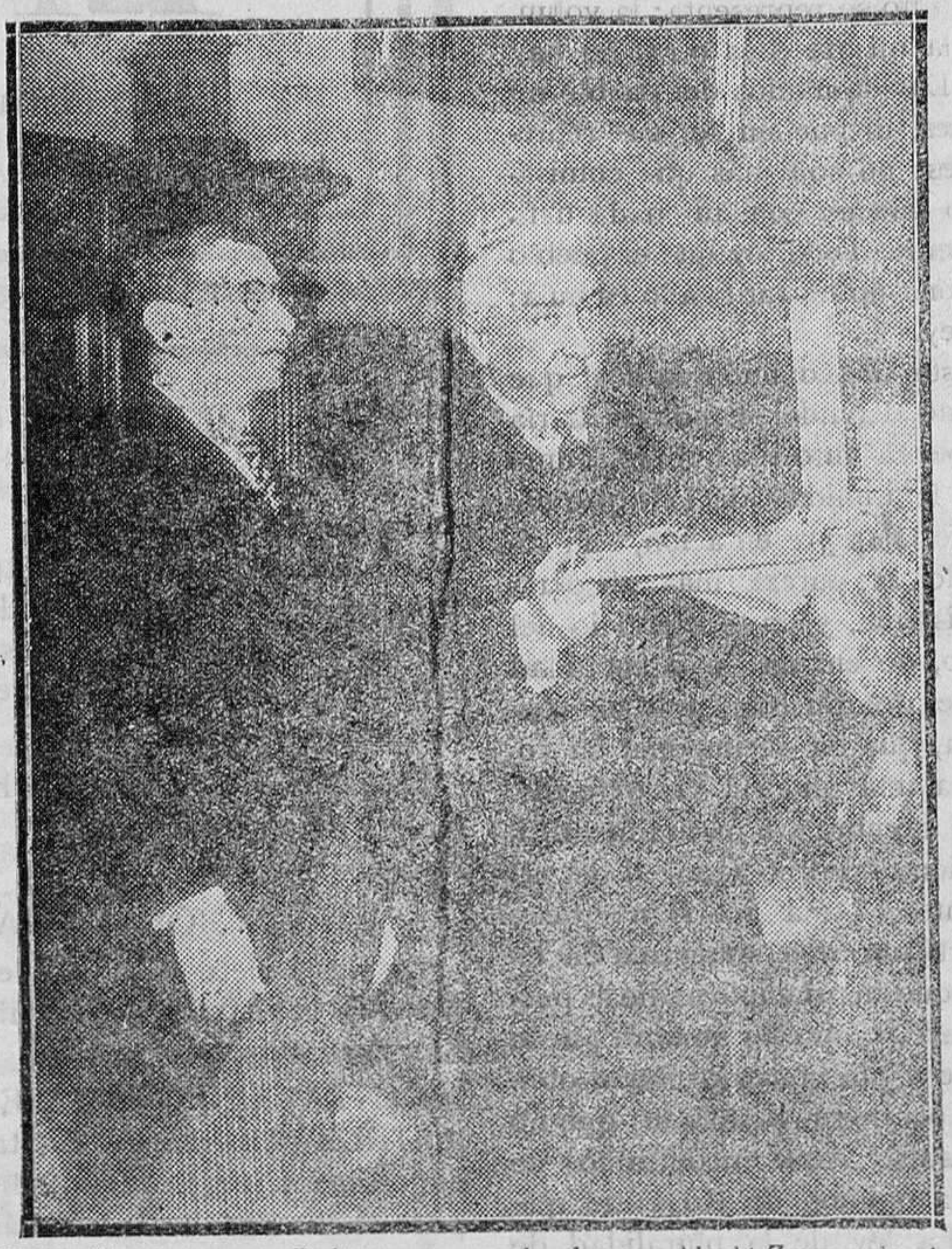
MADRID.—El ministro de Bolivia entregando al señor Alcalá Zamora las llaves del Gran Condor

Véndese en la Librería de Manuel Sintes Rotger, Plaza de Pablo Iglesias número 17, Mahón.