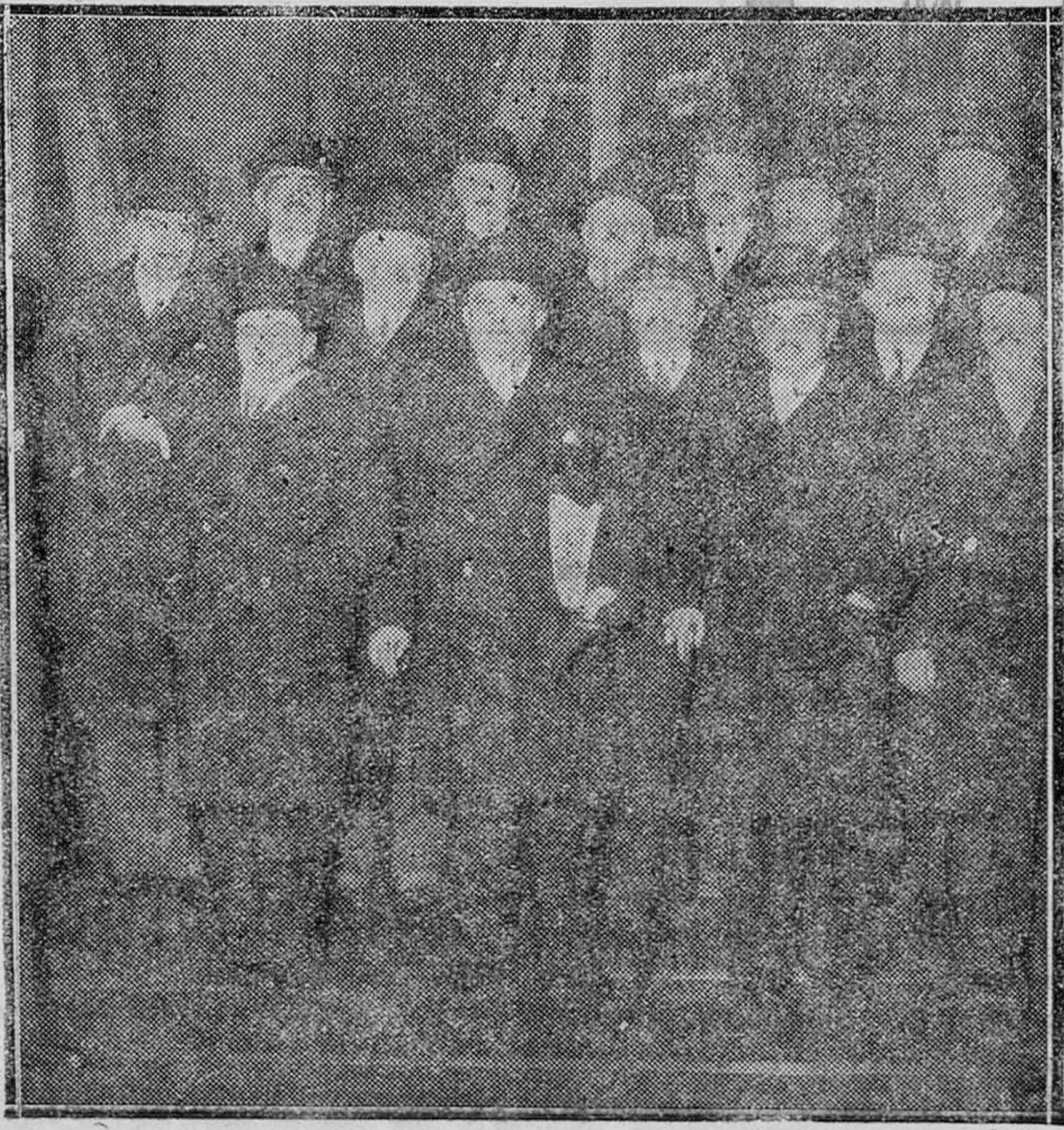
PARIS. — El nuevo Ministerio francés presidido por M. Tardieu, a la salida del Elíseo