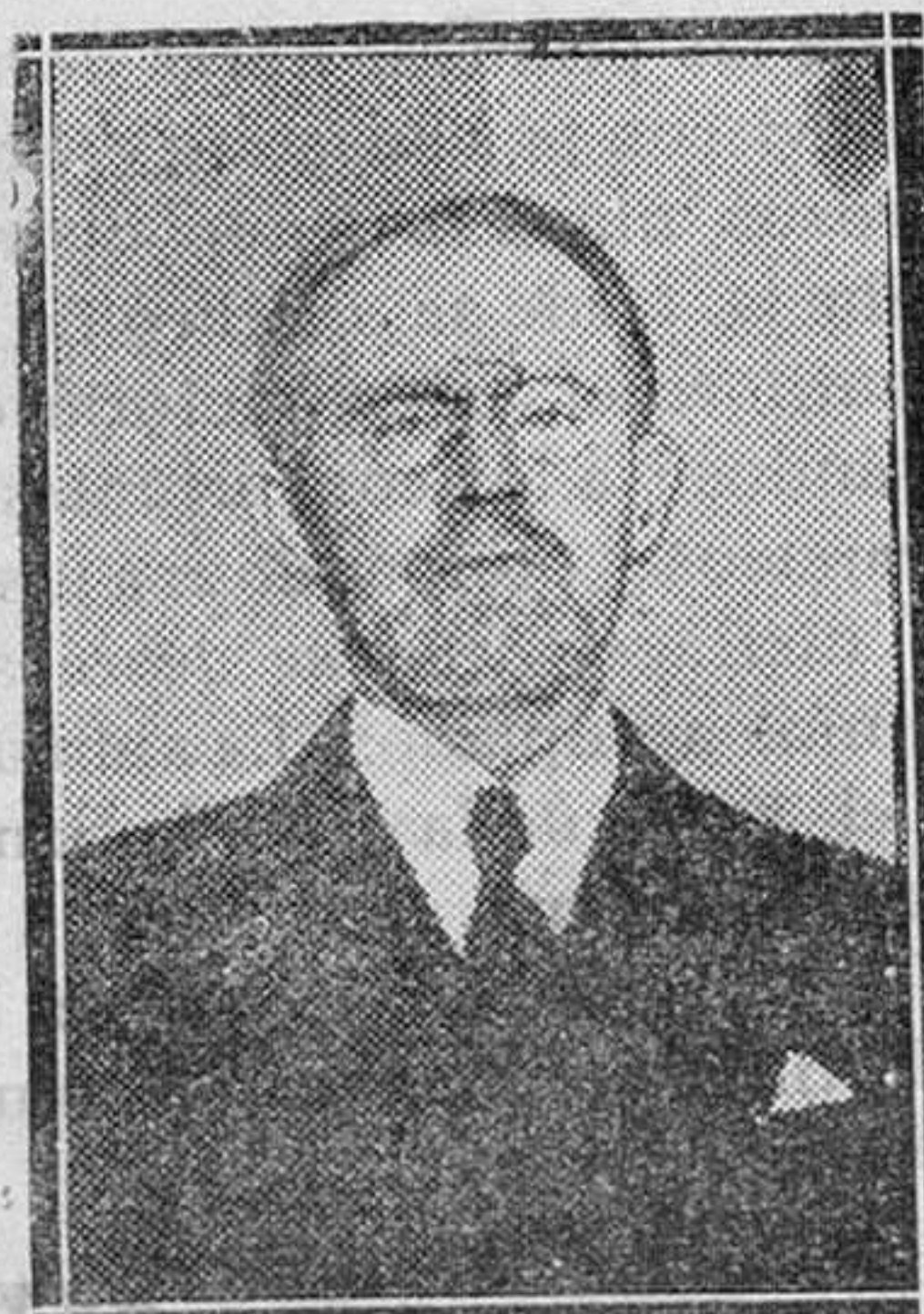
El ministro de Checoslovaquia señor Kibal, que dió una conferencia en el Pabellón de Valdeilla de la Universidad Central