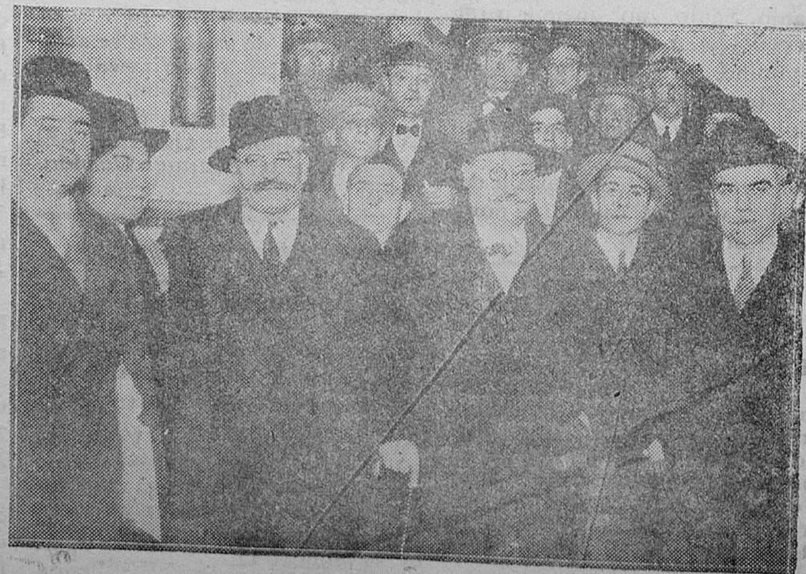
MADRID.—El socialista francés M. Renaudel en la Casa del Pueblo, después de la conferencia