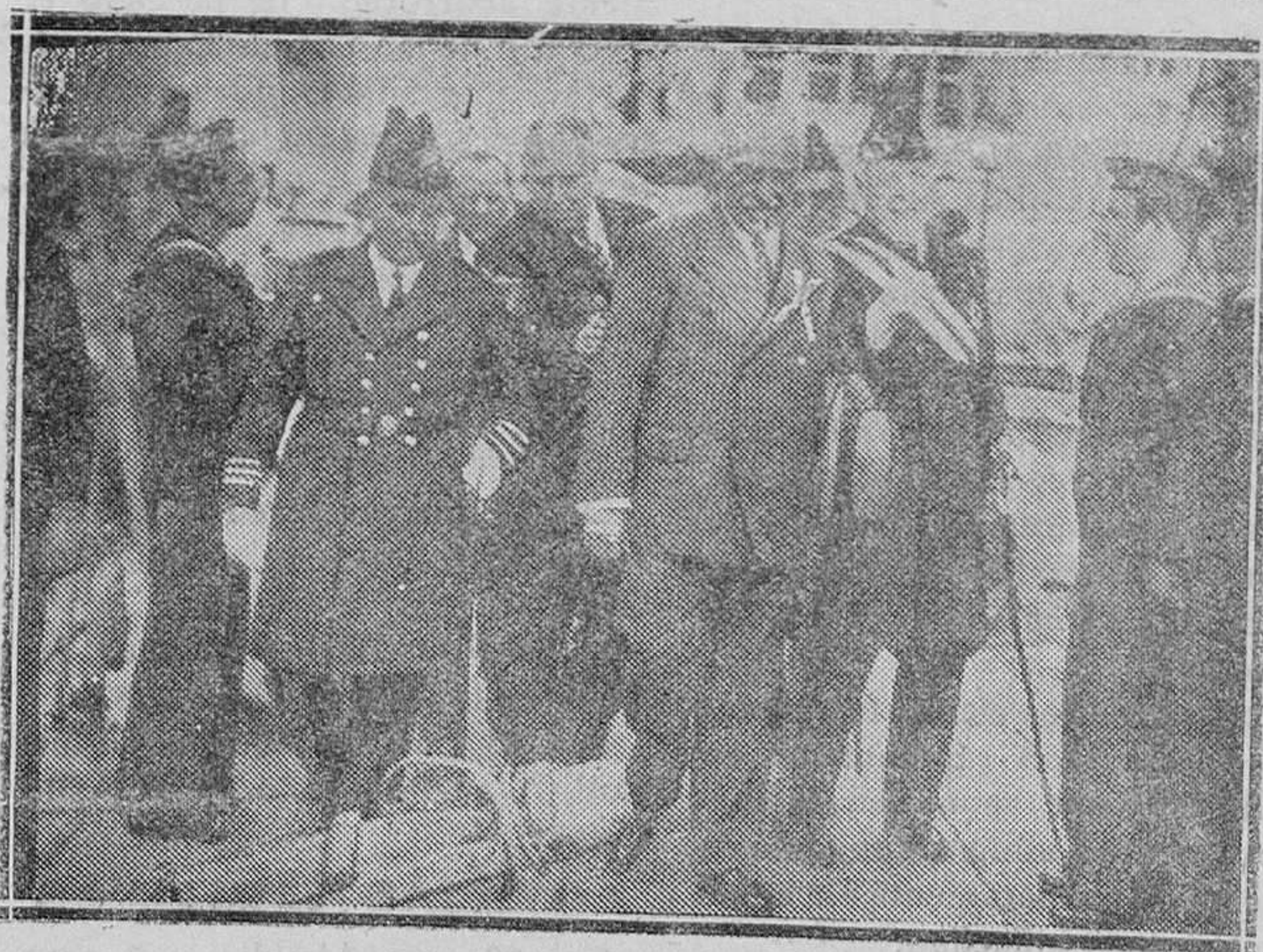
ALICANTE.—Llegada del Presidente de la República al puerto, donde visitó, acompañado de las autoridades, los barcos de guerra surtos en aquellas aguas